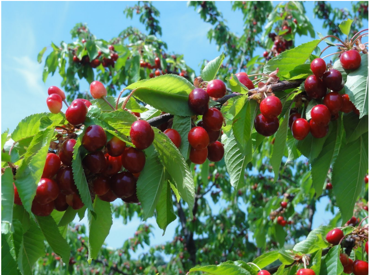
Češnje Goriških Brd, ki prinesejo prvi letni zaslužek