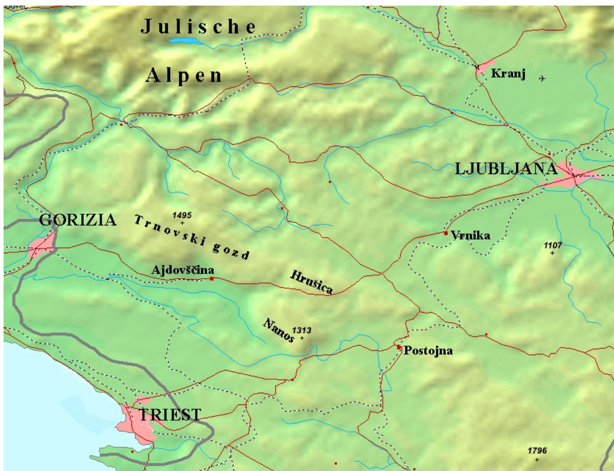
Vodovje Goriških Brd in okolice