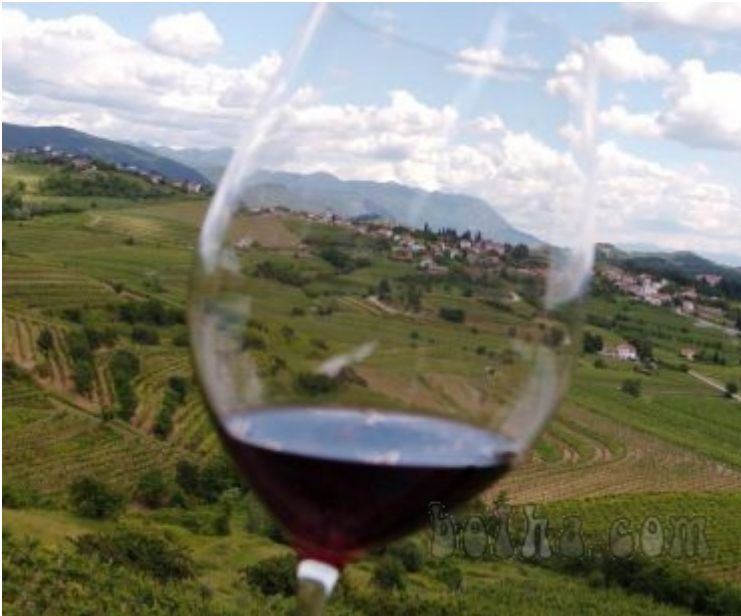
kmetijstvo na Goriških Brdih