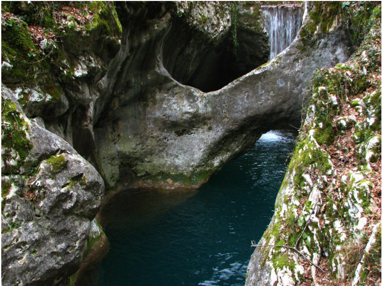
Dolina Kožbanjčka in njen naravni kamniti most