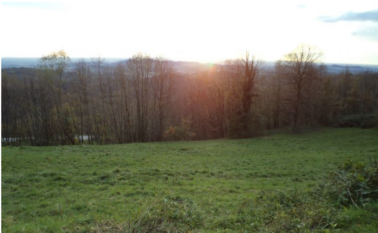
Gozd Goriških Brd