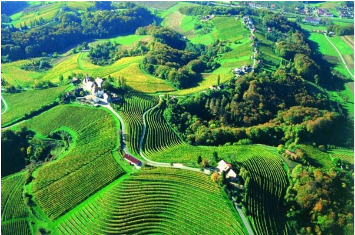
terasaste pokrajine kjer gojijo vinsko trto