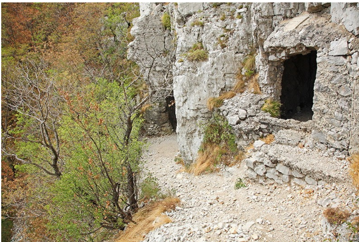
Sabotin, kjer so zgrajene kaverne in predori iz 1. Svetovne vojne