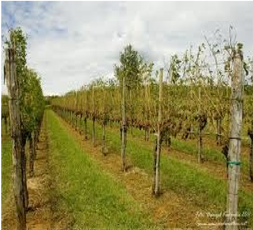
Sadovnjaki, kjer gojijo različno sadje