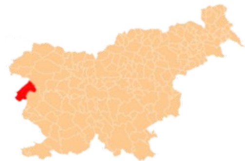
Lega Goriških Brd v Sloveniji