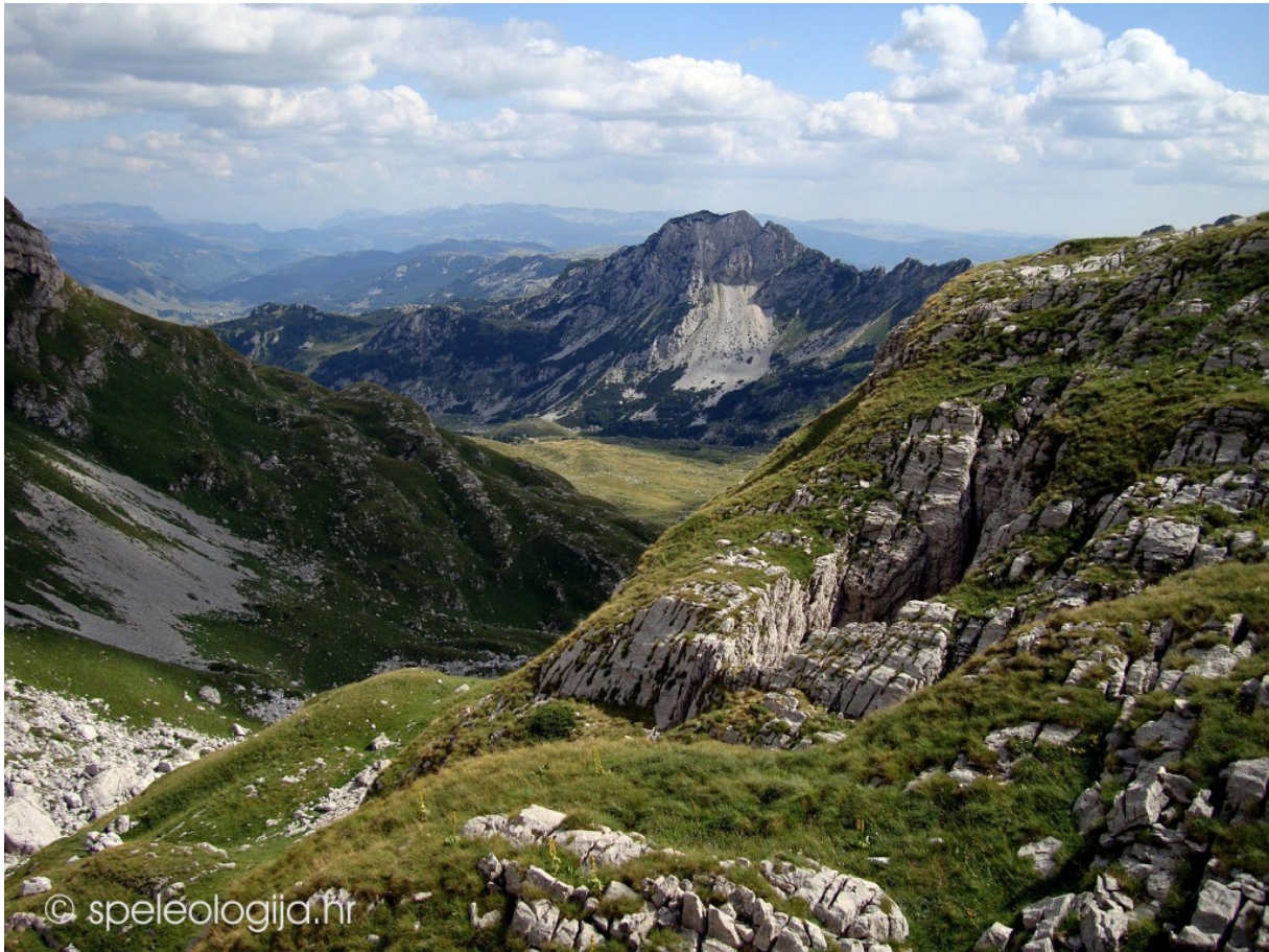
površje iz fliša