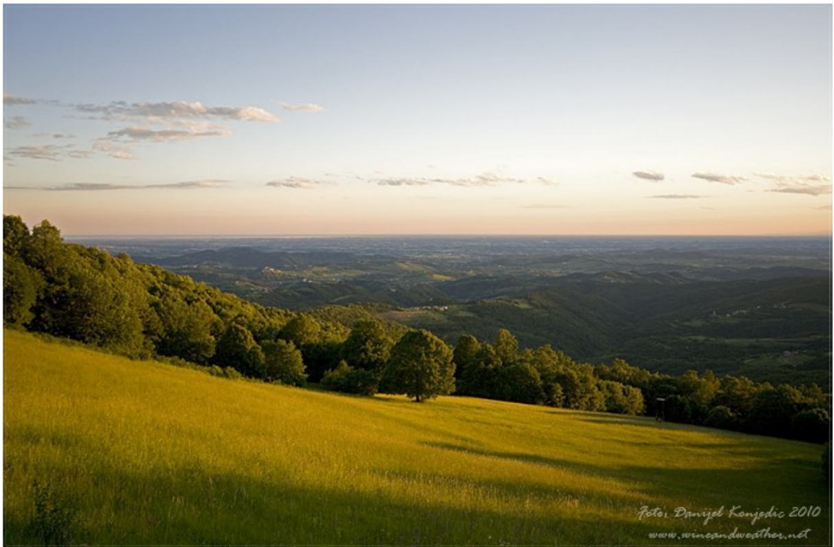
Najvišji vrh Goriških Brd- Korada, ki je visok 812m