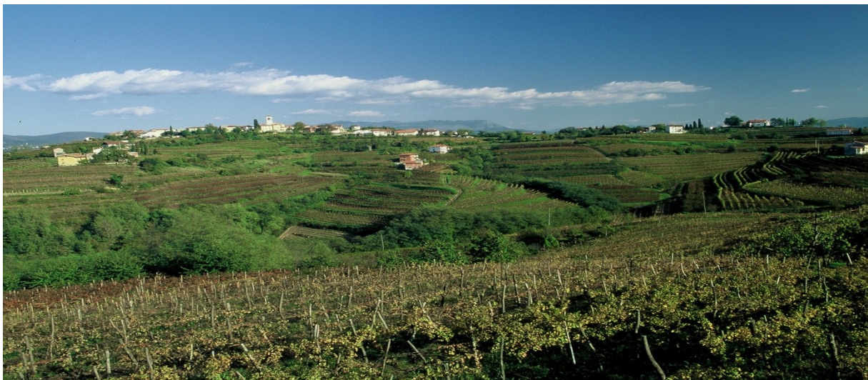
Površje Goriških Brd