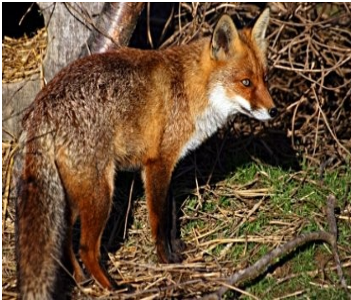
nekaj gozdnih živali v tej pokrajini