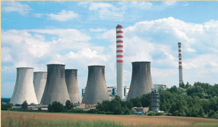
termoelektrarna v Gornji Šleziji