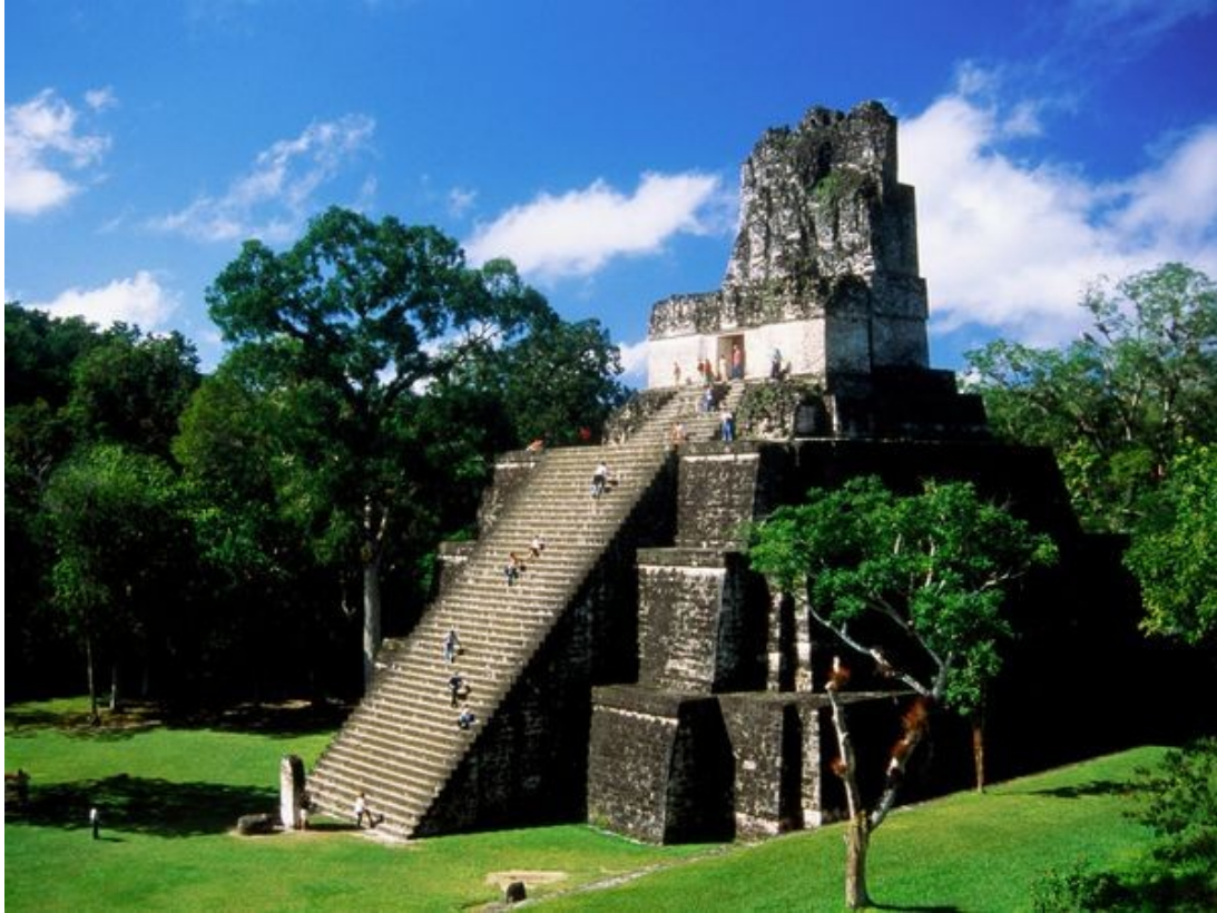
Slika 2: Tikal