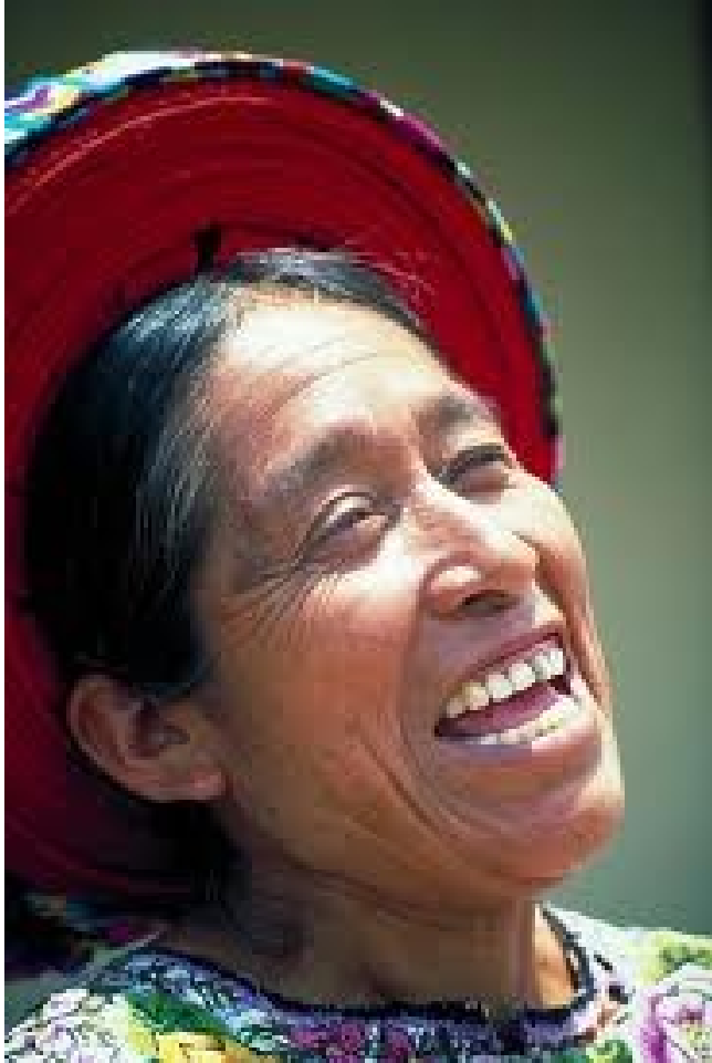
Slika 3: Majevska ženska