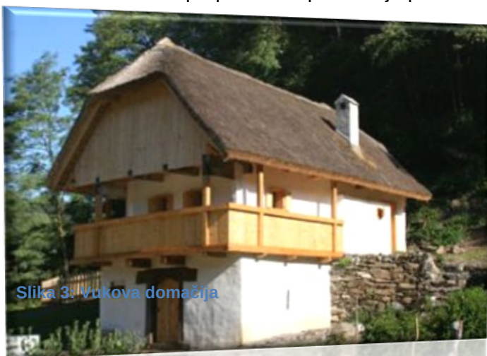
Slika 3: Vukova domačija

Lesena hiša z ognjiščno kuhinjo, sobo s krušno pečjo, balkonom in slamnato streho stoji na kleti, zidani iz kamna. Nastala je v osemdesetih letih 19. stoletja. Po izročilu jo je za preživljanje počitnic in upravljanje posesti dal zgraditi premožen meščan iz Ptuja. To potrjujejo tudi pisani viri, po katerih je bila od leta 1887 do leta 1904 v posesti ptujske družine; kupil jo je Blaž Horvat, čigar dediči so bivali v njej do konca 20. stoletja, ko je po smrti zadnjega stanovanca, vaškega rokodelca Vuka, prešla v last žetalske občine. Nasploh je bilo še v prvi polovici 20. stoletja več skromnih lesenih hiš kot ilovnatih in zidanih stavb, s slamnato streho in preprosto razporeditvijo prostorov: vežo, kuhinjo, veliko in malo sobo.