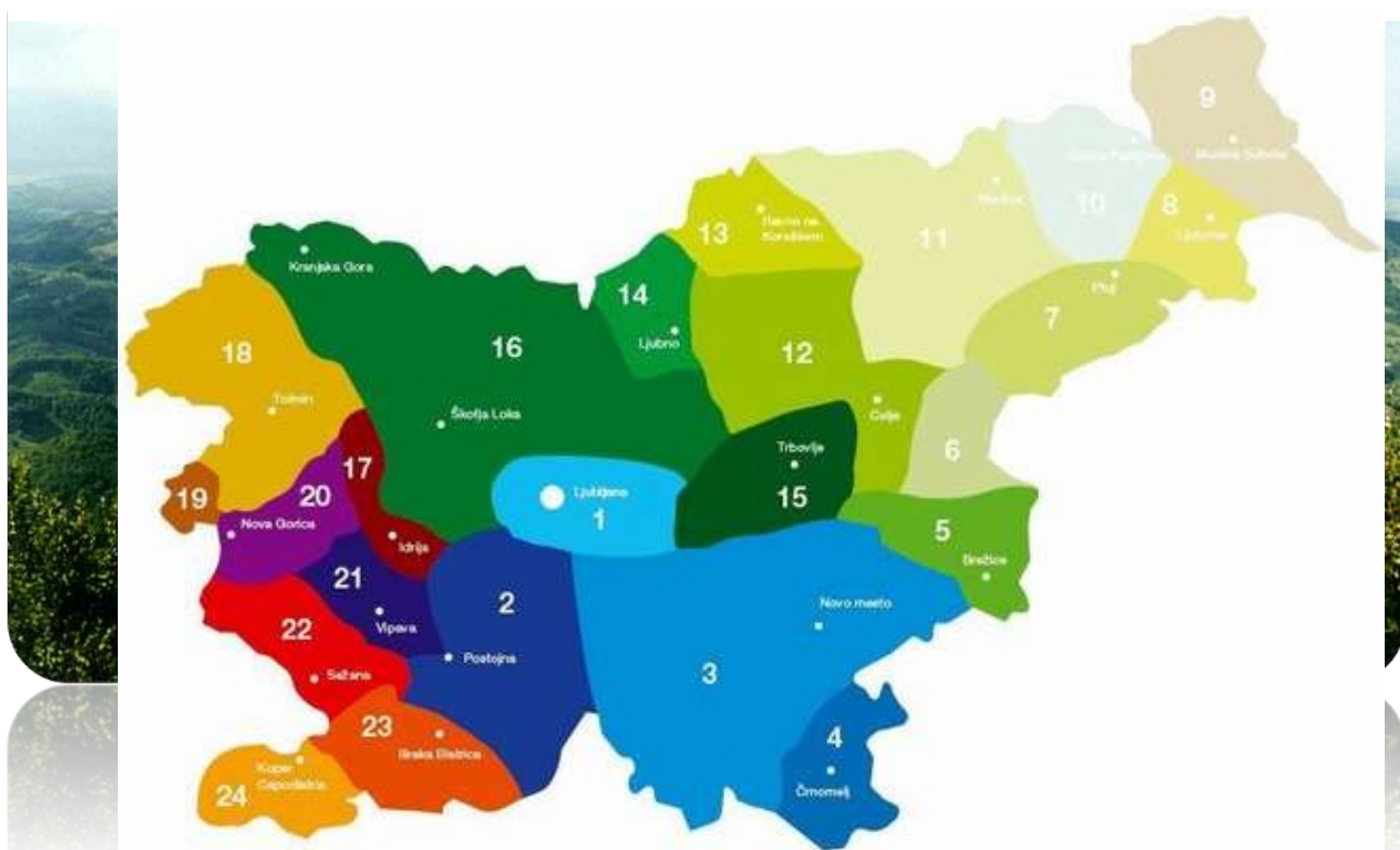
Slika 2: Št. 7 Haloze

So gričevnata pokrajina z močno razvejanimi pobočji na nepropustni matični podlagi. Na severu jo obrobata reki Dravinja in Drava, na zahodu jo omejuje Boč, na jugu pa Donačka gora in Macelj. Gričevnata pokrajina se na vzhodu in jugovzhodu razteza na hrvaško stran.