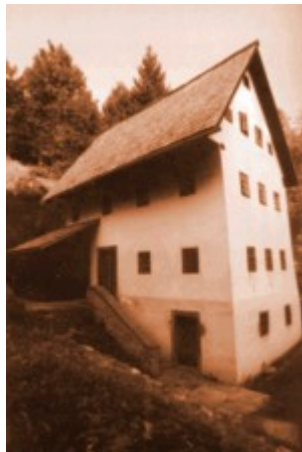
Slika 3: Rudarska hiša

Vest, da so v kotlini odkrili živo srebro, se je hitro razširila. Trume rudarjev, pa tudi oportunistov so prihajale iz Italije, s Koroške in Tirolske, z njimi pa tudi bogati benečanski trgovci.