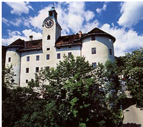
Slika 4: Grad Gewerkenegg, danes v njem stoji mestni muzej in Glasbena šola Idrija

Znameniti idrijski grad Gewerkenegg, ki sicer nikoli ni služil za obrambo, je bil zgrajen leta 1527. Njegov namen je bil shranjevanje živega srebra in domovanje rudniške uprave.