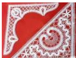
Slika 2: Idrijska čipka

Turisti, ki obiščejo mesto, si običajno ogledajo Antonijev rov, muzej na gradu Gewerkenegg in orjaško vodno črpalko Kamšt. Naše mesto pa slovi tudi po čipkah, ki so jih žene rudarjev klekljale v prostem času.