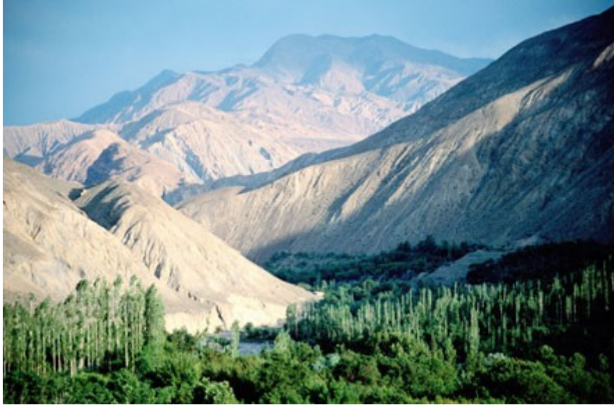
Provinca Kerman – cesta do puščave