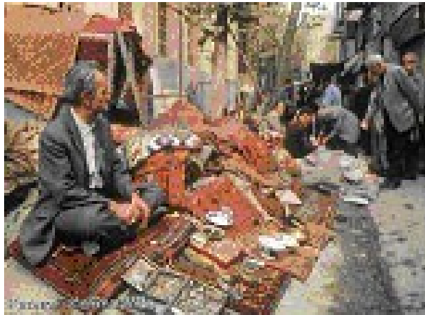
Izdelovalec preprog na ulici

Islamska revolucija in vojna z Irakom pa sta močno prizadeli gospodarstvo in pridobivanje nafte, ki se je v letih 1980-86 občutno zmanjšalo. Pomemben delež v gospodarstvu in izvozu imajo stare obrti. Zbiralci po vsem svetu visoko cenijo ročno vzlane preproge in pregrinjala. Konec osemdesetih let so v Iranu izdelali okoli štiri milijone kvadratnih metrov preprog. Iran trguje z Japonsko, Veliko Britanijo, ZDA, Rusijo, Singapurom in Indijo.