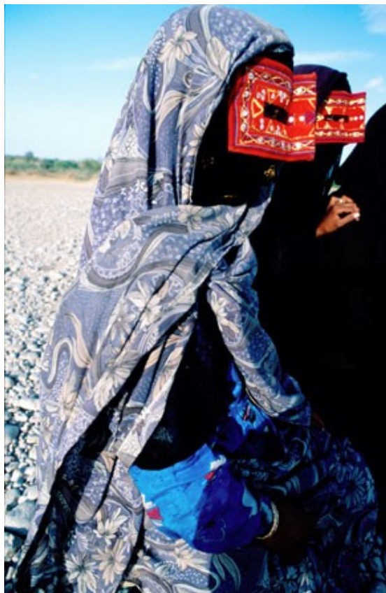
Ženske iz Minaba nosijo določene maske da zakrijejo obraz