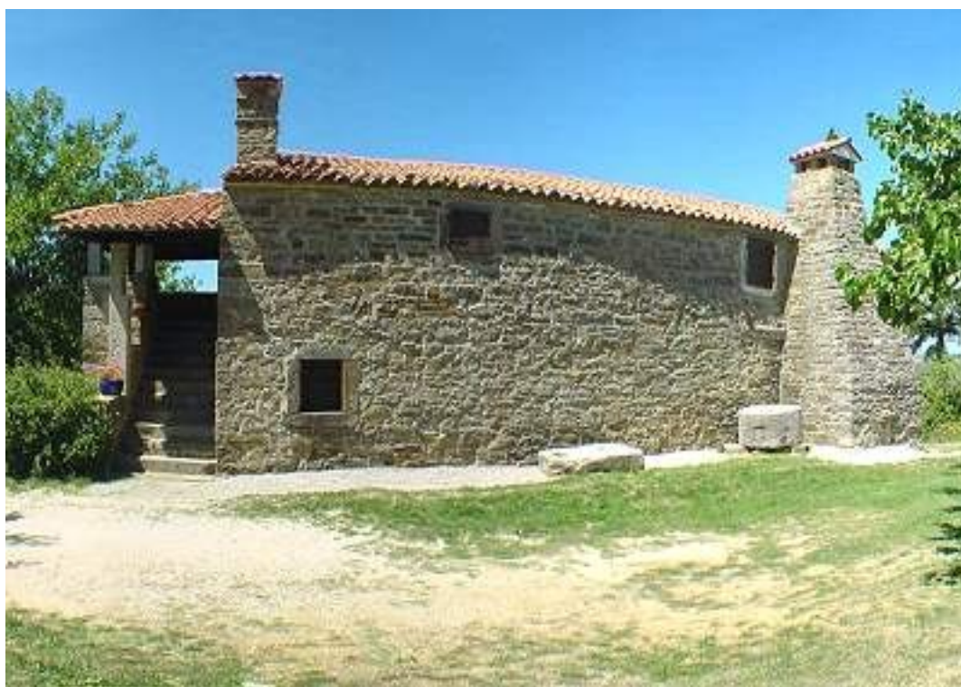
Slika 4-Novi tip istrske hiše, Tonina hiša v Svetem Petru

Novejša istrska hiša je nastala iz težnje po prostornejši hiši. Od starega tipa se razlikuje predvsem po razporeditvi stanovanjskih in gospodarskih prostorov. Bivanju je namenjeno tako pritličje kot nadstropje, pri tem so spalnice v etaži, kuhinja pa pod njimi. Vhod v hišo je v pritličju, tako da se vstopa direktno v kuhinjo. Pri poznejših gradnjah, ki se na zunaj ločijo po tem, da so ometane, se vstopa v majhen predprostor. V pritličju so še shramba in klet. Iz kuhinje ali predprostora vodi leseno stopnišče do sob v nadstropju in naprej na podstrešje, kjer je kašča. Sobe imajo lesena tla, kuhinja ali celotno pritličje pa sta tlakovana s kamnitimi ploščami. Kuhinja je glavni prostor v hiši in je edini ogrevan. Gospodarski del je zraven hiše nizu, prislonjen nanjo ali samostojen