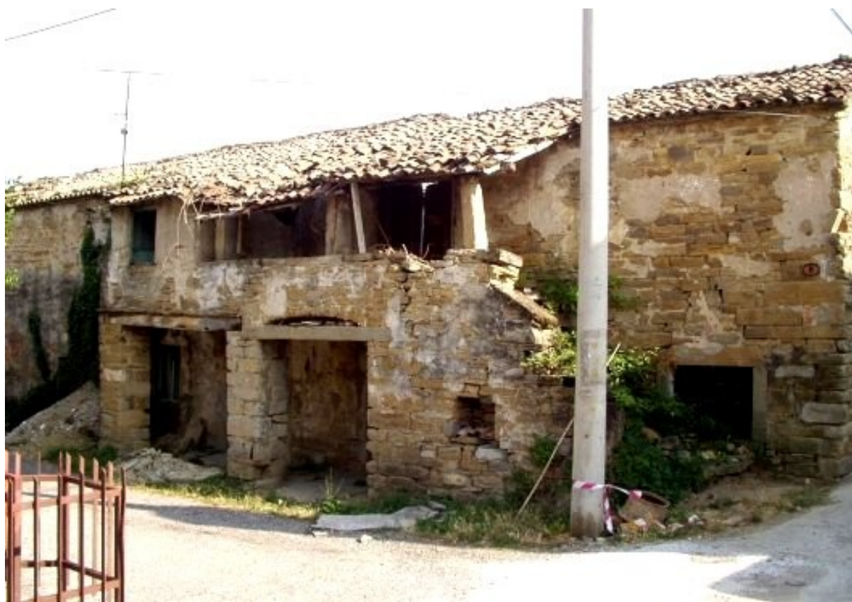
Slika 2- Stari tip istrske hiše

Nekatere hiše imajo kamnite žlebove. V nadaljnjem razvoju so hlev izločili iz hiše in ga postavili zraven, tako da je pritličje služilo kot klet. Bivalni del pri tem doživi spremembe. Nekatere hiše starega istrskega tipa nudijo še eno zanimivo varianto. Kuhinja skupaj z gospodarskim delom pod njo je postavljena kot priključni del, ki izstopa iz sprednje fasade hiše in je dostopna preko baladurja. Verjetno gre tukaj za pridobivanje prostora. Zunanje stopnišče poteka vzporedno s fasado. V primeru ko so hiše postavljene v nizu, je stopnišče zaradi bližine sosednjega baladurja pravokotno na fasado oziroma prvi del pravokotno nanjo, nato vzporedno. Pod baladurjem pogosto nastaja odprtina v obliki loka (volta), kjer je vhod v gospodarske prostore. Pod volto sta hlad in močna senca, ki ščitita vinsko klet pred segrevanjem. Baladur je majhna terasa pravokotne ali kvadratne oblike, ki je lahko prekrita s pergolo oziroma z eno ali trikapno strešico, podprto s kamnitimi stebrički. V delih Istre, siromašnih z vodo, gradijo cisterne za zbiranje deževnice. To je lahko velika skupna cisterna ali samostojna, ki se pojavlja v izoliranih hišah, kjer je naselitev redkejša. Cisterne so nadzemne in ustvarjajo teraso, ki je dostopna iz notranjosti hiše ali pa tudi preko zunanjega stopnišča; ponekod nadomešča baladur.