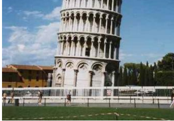
STOLP V PISI

Stolp v Pisi stoji na trgu Piazza dei Miracoli . Do vrha vodi 296 stopnic.