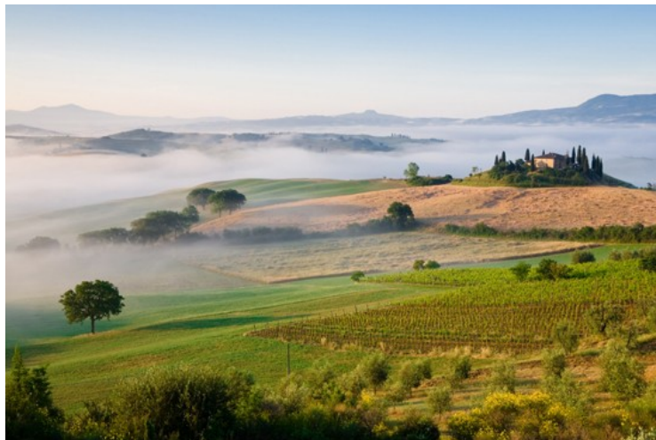
Slika 4: Toskana

Najpogosteje naseljena območja so Padska nižina, Toskana, okolica Rima in Neaplja, najredkeje poseljeni so gorski svet Alp in Apeninov ter notranjost Sicilije in Sardinije. Italija je tradicionalno dežela izseljevanja in je v zgodovini z izseljevanjem izgubila velik del naravnega prirastka. Veliko ljudi (okoli 20 mil. Izseljencev) se je pred drugo svetovno vojno izselilo večinoma v Ameriko in Argentino. V 80. in 90. letih so zaradi pomanjkanja delovne sile prišli priseljenci iz severne in zahodne Afrike in Albanije. Večja mesta so: Rim(2,65 mil.), Milano(1,31 mil.), Neapelj(1,05 mil.), Torino(0,95 mil.), ...