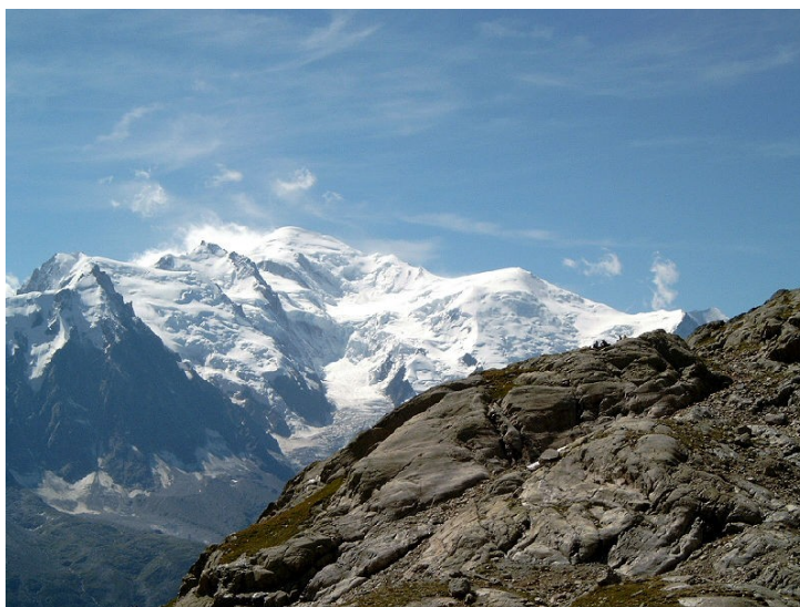
Slika 3 : Mont Blanc

V Alpah je podnebje gorsko, v Padski nižini submediteransko, drugod po državi pa sredozemsko. Alpe dobijo na leto okoli 2000 mm , Padska nižina 800-1000mm, južni deli Apeninskega polotoka in Sicilija pa 500-700mm padavin. Ker v Alpah letno pade veliko padavin, jo seveda tudi veliko odteka, in zato ima Italija kar nekaj velikih rek, najdaljša pa je Pad z dolžino 652 km in se izliva v Jadransko morje. Ob vznožju Alp so tudi velika jezera (Gardsko-370 km 2 ). Najbolj rodovitna tla so v Padski nižini in na vulkanskih kamninah. V gričevjih in hribovjih je možna erozija, zato so pogosti zemeljski plazovi. V Alpah in Apeninih so tudi mešani gozdovi, ki zavzemajo 23% kopna Italije.