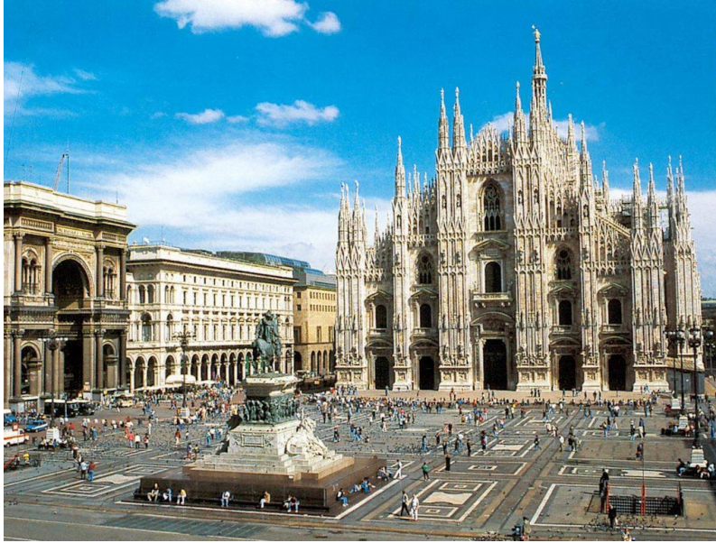
Slika 8: Trg v Milanu