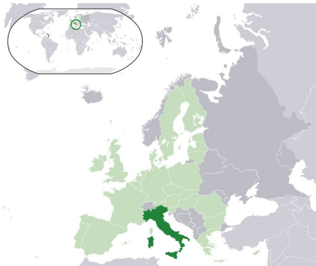
Slika 1: Zemljevid Italija (vir:[URL: http://sl.wikipedia.org/wiki/Italija ]25.1.2010)

Italija je obmorska država v Južni Evropi. Leži na Apeninskem polotoku. Na severu jo omejujejo Alpe, na vzhodu Jadransko morje, na jugu in zahodu pa na Sredozemsko morje. Na severu meji na Švico in Avstrijo, na severovzhodu na Slovenijo, na severozahodu pa na Francijo. Sestavljata jo tudi dva velika otoka in sicer Sardinija in Sicilija. Glavno mesto Italije je Rim, ali po italijansko, Roma. V Italiji so tudi dve žepni državi San Marino in Vatikan.