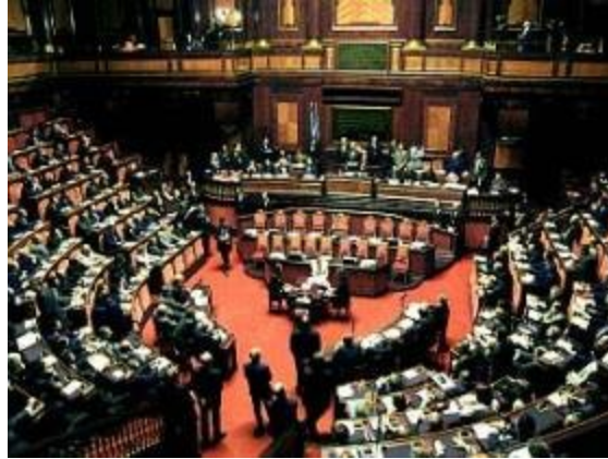
Slika 5:Italijanski parlament