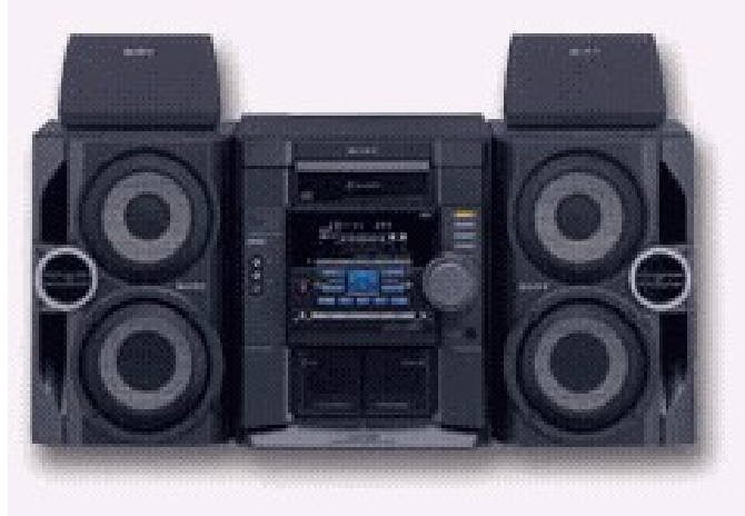
Slika 11 Glasbeni stolp Sony