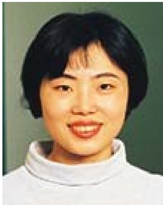
Slika 9 Japonka