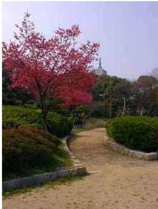
Slika 5 Japonski javor

Nekako 2/3 države prekriva gozd, čeprav se je prvotna gozdna odeja ohranila le malo kje. Bambusovi gozdovi segajo na sever do Tokija in dajejo zelo uporaben les, vršički in korenine pa so užitni. Lepoto cvetočih češenj opevajo pesniki in slikarji, sadijo jih povsod, v gorah rastejo divje. Rastnih predelov je pet. Najjužneje, v bližini ekvatorja, raste na otočju Rjuku, Bonin in Vulkanski otoki poltropski gozd s kafovci, drevesasto praprotjo in murvami. Drugi, subtropski pas se začne na višjih pobočjih jugozahodnih otokov, kjer rastejo na Jokuju južno od Kjušoja, dvotisočletne japonske cedre. Ta pas sega na Kjušuju do nadmorske višine 1000m, na severnem Honšuju pa se zniža na obalno raven. Širokolistni listopadni in mešani gozdovi so značilni za tretji pas, ki na Šikokuju sega do višine 2000 m. Značilna drevesa so: bukev, breza in hrast. V četrtem pasu raste predvsem severni iglasti gozd, ki se začneja tam, kjer je povprečna letna temperatura nižja od 6 °C, torej na višavah osrednjega Honšuja in Hokaida. V tamkajšnjih gozdovih rastejo sahalinska smreka, sahalinska jelka ter modra jelka. Na najvišjih rastiščih se gozd umakne grmičevju, krmežljavim borovcem in visokogorskim cvetnicami.