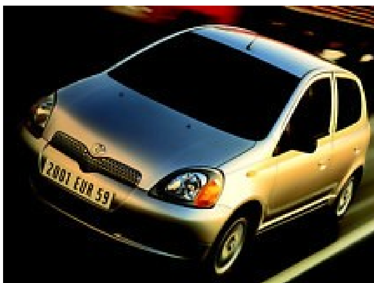
Slika 10 Avto Toyota

Po drugi svetovni vojni si je Japonska hitro opomogla, imela je prepoved oboroževanja. Zgradili so bančne sisteme, uvažali tuje izdelke, zaposlovali tuje strokovnjake in se tako hitro naučili uspešnega poslovanja in izdelave kvalitetnih izdelkov. Med letom 1953 in 1970 se je zgodil takozvan japonski gospodarski čudeš.