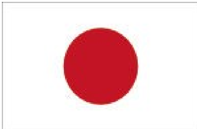
Slika 1 Japonska zastava