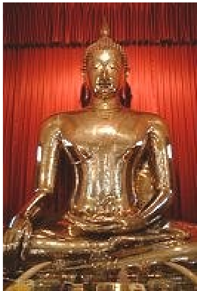
Slika 8 Kip Bude

Vera je pri Japoncih del vsakdana. Večina je šitoistov (japonska deželna vera) in Budistov (75%). Ti veri si ne nasprotujeta in mnogi verujejo obe. Pri Japoncih je izobrazba zelo pomembna. Imajo strog šolski sistem, za sprejem na univerzo pa je potrebno opraviti zelo zahtevne izpite. Japonsko prebivalstvo pa je znano tudi po precej tradicionalni vlogi ženske v družini in družbi ter v povprečju najdaljši življenjski dobi na svetu.