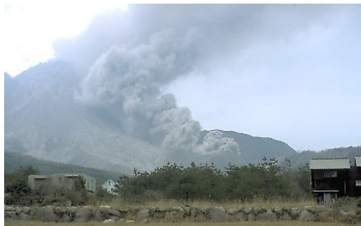
Slika 3 Vulkanski izbruhi

Država ima tudi največje število ognjenikov na svetu. Ognjeniški izbruhi so v davni preteklosti pustili za sabo rodovitno zemljo, mlajši izbruhi pa puščajo za sabo golo in pusto zemljo.