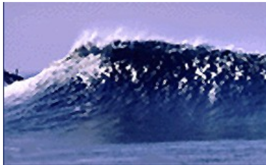
Slika 2 Tsunami- rušilni val

Na Japonskem so zelo pogosti razni geološki pojavi. Na to kaže že podatek, da so v tej državi med vsemi na svetu potresi najbolj pogosti. Državna seizmografska zveza zabeleži približno 7000 potresov letno, samo na področju Tokia pa se tla tresejo vsak teden. Kadar je epicenter potresa pod morskim dnu, pa nastanejo tako imenovani tsunamiji, ki poplavijo in rušijo vse pred sabo. Japonci se naravnim silam upirajo z modernim načinom gradnje in visoko tehnološkimi dosežki.