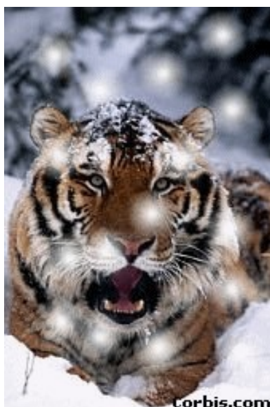
Slika 7 Japonski tiger