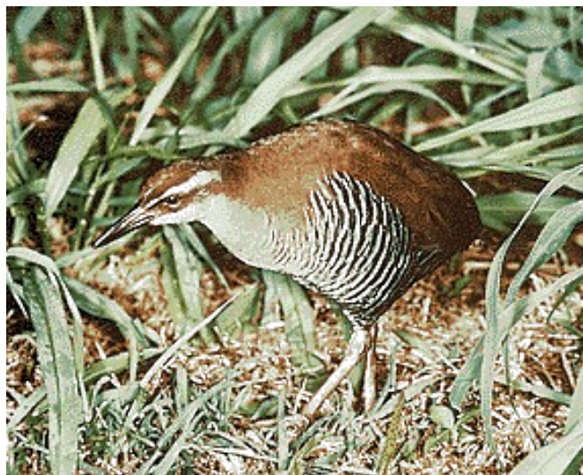
Slika 6 Ptič guamato

Na gozdnatem višavju v notranjosti živi veliko različnih živali. Divje svinje rijejo po podrastju, medvedi in enooki ( rakunji ali kunji pes) lovijo zajce, srnjad antilope in opice (japonski makok živi severneje). Obilo plazilcev in dvoživk, med njimi so kuščarji, želve in kače, na primer nevarni morski krait in strupenjače. Japonski močerad, živi na Honšuju in Kjušuju, lahko zraste do poldruega metra velikosti. Vode vzhodno od rta Inulo so med najbogatejšimi ribjimi lovišči na svetu, tam živijo trske, lososi in številni lupinarji.