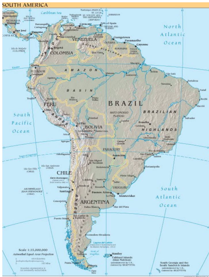
Slika 12-države Južne Amerike

seboj, tako po številu prebivalstva in v bogastvu, v marsičem pa so si tudi zelo podobne. Posledica evropskega osvajanja v 15. stoletju je prevlada španščine in portugalsčine pri veliki številu prebivalstva. Velika večine zemlje pa je še vedno v lasti veleposestnikov; ti pa imajo v rokah tudi državno oblast. V Južni Ameriki živijo poleg mešancev, belcev, črncev in mesticev tudi Indijanci, ki so ponekod še ohranili prvine starih kultur.