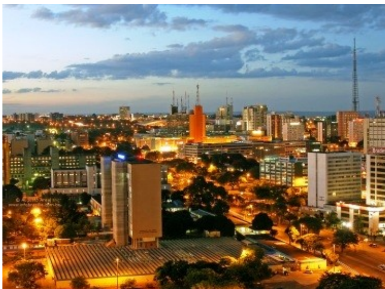
Slika 11-glavno mesto Brazilije-Brasilia, je turistično zelo obiskano mesto

turistični objekti, v notranjosti pa so se ohranile stare indijanske vasi. Prav te so privlačne za turiste, nič manj pa jih ne zanimajo tudi ljudje, kateri bivajo v tovrstnih vaseh. Dobro je razvit letalski, železniški in pomorski promet, vendar peša. Tudi ceste imajo pomembno prometno vlogo, torej je razvit tudi cestni promet.