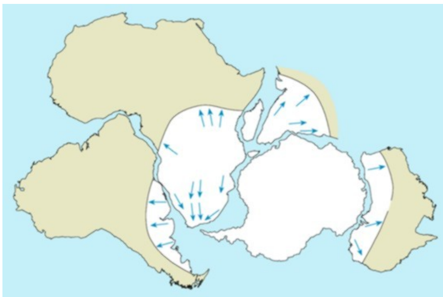
Slika 1: Praelina Gondvana in smer razhajanja le-te (Vir:internet)

Andi so se začeli dvigati šele v terciarju, približno pred 60 milijoni let, in so geološko najmlajši del Južne Amerike.