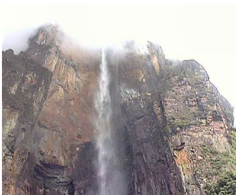
Slika 16-najvišji slap na svetu