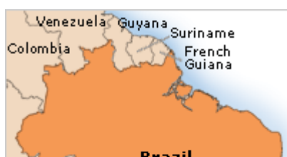
Slika 14-Brazilija z označenim glavnim mestom

Federativna republika Brazilija je največja in najbolj naseljena država v Južni Ameriki. Širi se prek ogromnega področja med Andi na zahodu in Atlantikom na vzhodu, meji pa na Urugvaj, Argentino, Paragvaj in Bolivijo na jugu, Peru in Kolumbijo na zahodu, Venezuelo, ter Gvajano na severu. Zavzema kar 8.511.965 km 2 . Brazilija je dobila ime po bražiljki ( Caesalpinia brasiliensis ), krajevnem listnatem drevesu, ki daje les za rdeče barvilo, v njej pa najdemo tako ekstenzivno kmetijska področja kot deževne pragozdove. Uradni jezik je portugalščina, plačilno sredstvo pa brazilski real. Predsednik Brazilije je Luís Inácio Lula da Silva, njihovo nacionalno geslo pa je Ordem e Progresso , kar pomeni red in napred