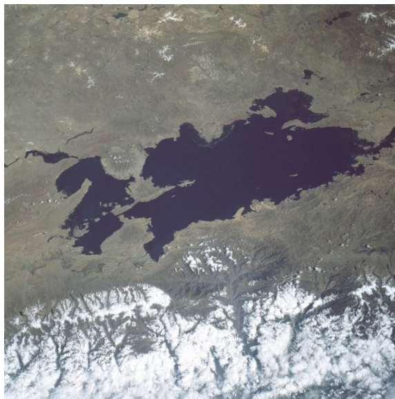
Slika 9-satelitski posnetek jezera Titicaca

Južna Amerika pa se lahko pohvali še z jezerom Titicaca, ki je tudi najvišje ležeče jezero na svetu; leži namreč na višini 3812m. Staro izročilo je trdilo, da je jezero brez dna, z novjšimi merjenji pa so ugotovili, da je največja globina 467m. Ima pomembno prometno pot, saj podnevi plujejo po njem trgovske in potniške ladje ter indijanski ribiški čolni, ponoči pa so na delu tihotapci.