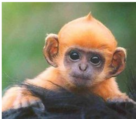
Slika 7-mlada kapucinka (vrsta opice)

imajo močan oprijemalen rep, s katerim se trdno in spretno oprijemljejo kot s peto okončino. Pogosto se razne vrste opic poganjajo za isto hrano na istem drevesu, v glavnem pa je njihova hrana zelo različna. Vriskači se hranijo z rastlinsko hrano, v glavnem s sadjem, manjše skakačke pa so se osredotočile na nedozorele sadeže, preden postanejo zanimivi za večje vrste. Kapucinke se hranijo z žuželkami, volnački pa jedo bolj raznovrstno hrano, v glavnem rastlinsko, vendar pa tudi jajca in žuželke. V vrhovih dreves živijo tudi lenivci, ki se obešajo z vej z glavo navzdol in tako preživijo večino dneva. Po raskavi dlaki se jim razraščajo zelene alge, zaradi česar jih je med listjem težko opaziti. Lenivci so samo rastlinojedi in porabljajo le malo energije; zjutraj izrabijo za pridobivanje telesne toplote kar sonce. Delijo se v dve vrsti, v dvoprste in triprste. Kakor opice so tudi lenivci priljubljen plen raznih plenilcev, na primer udavov in anakond ter velikih orlov. Jaguarji, ki so podobni leopardu, vendar so precej težji, se držijo tal in celo vode, saj so odlični plavalci. Pojedo vse, kar dobijo. Najpogosteje lovijo gozdne talne rastlinojede živali, recimo tapirje (ta je soroden konju in nosorogu) in pekarije (nekakšne prašiče).