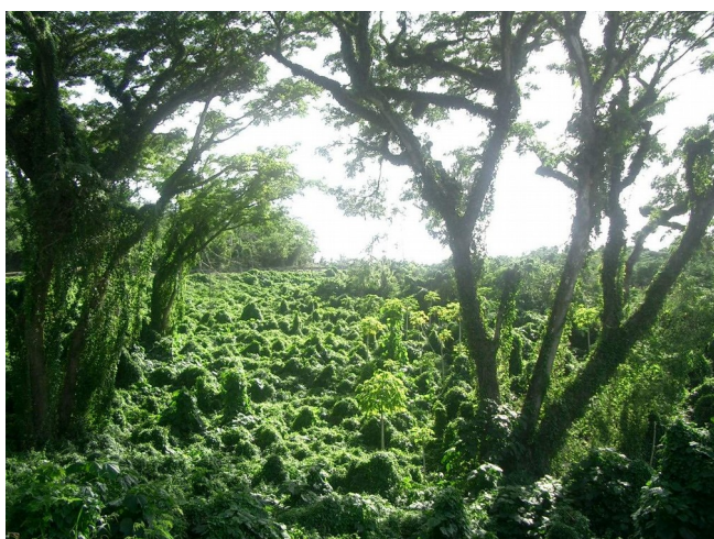
Slika 6-tropski deževni gozd

Zemljo je v davnini obdajal pas tropskih deževnih gozdov in največji še ohranjeni gozd je v porečju Amazonke. To ozemlje meri skoraj 7 milijonov kvadratnih kilometrov in dobiva ponekod več kot 3000 milimetrov dežja na leto. Četrtno vse vode, kar je z Zemljinega površja odvajajo reke, vsebuje Amazonka. Tropski deževni gozd daje zavetje, hrano in življenjski prostor živalim in plamenom. Zaradi poseganja modernega človeka v ta enkratni raj, z grajenjem železnic, avtocest in objektov, pa se tropski deževni gozd naglo krči. Do zdaj pa je izginila že več kot polovica deževnih gozdov. Značilni primer je Brazilija. Deževni gozd so pljuča planeta. S krčenjem pospešujemo toplogredni učinek. Leta 2004 so v Braziliji uničili več kot 26.000 km 2 deževnega gozda, kar je več kot cela Slovenija! Z golosekom, zaradi hitrega dobička, so ogrožene številne živalske in rastlinske vrste. Deževni gozd tudi požigajo, da bi pridobili površine za kmetovanje. Te površine so po nekaj setvah osiromašene, zato tam ostane le gola zemlja.