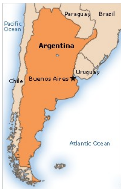
Slika 13-Republika Argentina z vpisanim glavnim mestom (vir:internet)

Buenos Aires, plačilno sredstvo pa argetinski peso. Klima je večinoma zmerna, izsušena in nerodovitna na jugovzhodu, subantarktična na jugozahodu. Lahko jo uvrščamo tudi med največje svetovne izvoznice žita in govejega mesa.