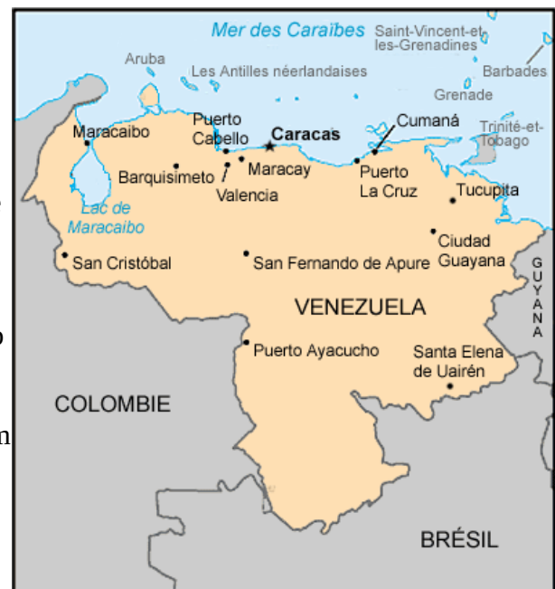
Slika 15-karta Venezuele z nekaterimi vpisanimi mesti

Venezuela je obmorska država v Južni Ameriki, ki je svoje ime dobila po Benetkah ( Venezuela špansko pomeni male Benetke ). Venezuela na severu meji na Karibsko morje in Atlantski ocean, na vzhodu na Gvajano, na jugu na Brazilijo, ter na zahodu na Kolumbijo. Ob venezuelski obali v Malih Antilih najdemo tudi karibske države Aruba, Nizozemski Antili in Trinidad in Tobago. Podnebje je tropsko, z deževno dobo od aprila do oktobra. Največ padavin prejme delta Orinoka, najbolj sušno pa je na delih Karibske obale, ki so v zavetju gora. Je pa tudi najbogatejša država Južne Amerike. Razlog za to, je prav gotovo nafta. Namreč, nafto so odkrili na območju Maracaibskega zaliva in ob spodnjem toku Orinoka, zato so dosegli visoko stopnjo gospodarskega razvoja. Glavno mesto je Caracas, uradni jezik je seveda španščina, medtem ko pa je valuta venezuelski bolivar. Obsega 912.050 km 2 , voditelj tega ozemlja pa je predsednik Hugo Chávez.