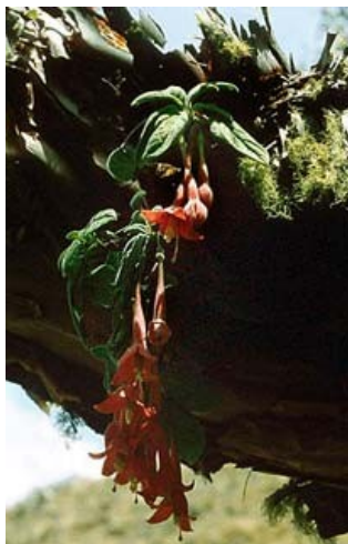
Slika 4-Epifit