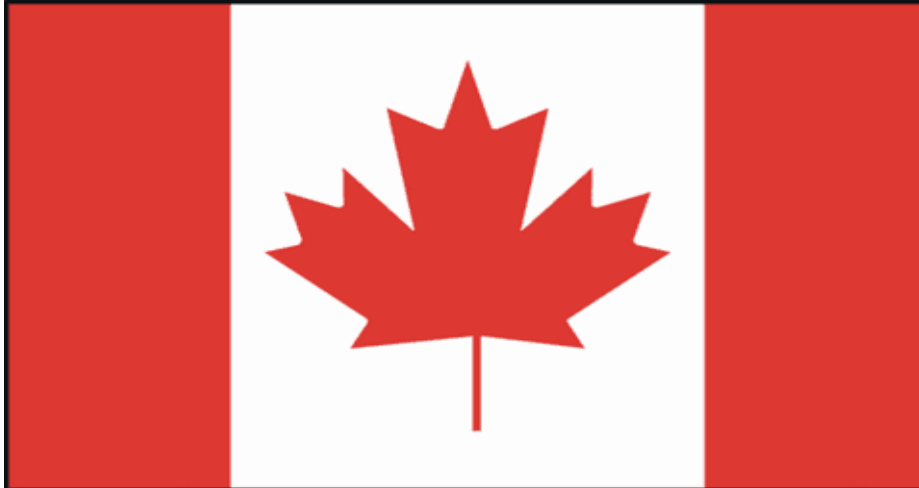
Slika 1: Kanadska zastava