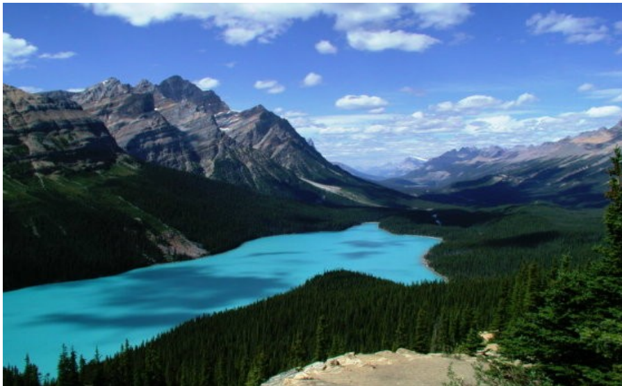
Slika 3: Narodni park Banff