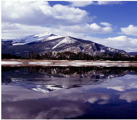
Slika 4:Skalno gorovje