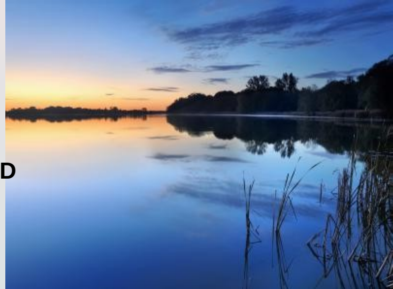
SOMRAK NAD JEZEROM ONTARIO