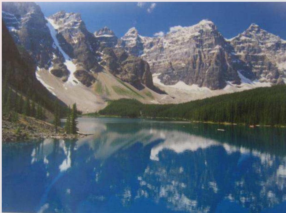
Narodni park Banff