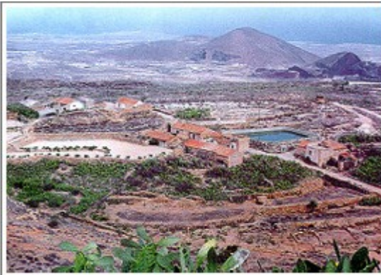
Slika št. 3: San Miguel