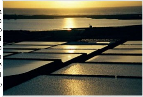
Slika št.12: salinas

obala z narodnim parkom Timanfaya je divja in hrapava. Najpomembnejši turistični kraji ležijo na vzhodnem delu otoka, kjer se pokrajina lahko nagne in zaključí v peščenih plažah in zalivih, ki potekajo do najjužnejše konice otoka. Naselja rastejo na jugu otoka in okoli glavnega letovišča Puerto del Carmen. Ponekod so bistveno preveč strnjena, a turizem vendarle še ni omadeževal otoka, predvsem če ga primerjamo z Gran Canario in Tenerifom.