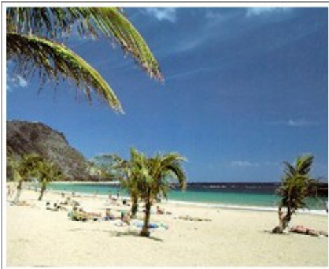
Slika št.2: Playa de las Tresitias

Plaže na Tenerifih naj bi veljale za ene najbolj čistih v Evropi, saj so znane po zelo čistem morju. Otok Tenerife zajema 358 kilometrov plaž, od naravnih do umetnih. V Las Americas lahko najdete več plaž, kot so Playa del Bobo, Playa de Torviscas, Playa de Troya. Veliko lepih plaž je na južnem delu otoka, kajti severni del otoka ima bolj strm dostop do vode zaradi vulkanskih ostankov. Južni del otoka pa je precej bolj topel in manj deževen kot severni del. Povprečna letna temperatura je 26 stopinj in trije deževni dnevi na leto. Playa de La Arena leži na jugu otoka zraven mesta Los Gigantes, polna črne mivke in velja za eno najbolj čistih plaž na otoku Tenerife. Plaže se nahajajo vse na enem mestu in med njimi ni veliko za prehoditi. Zelo zanimivo je tudi ogledovanje surfarjev, saj se na določenem mestu valijo prelepi valovi. Mesto El Médano slovi po surfanju. Plaže so peščene in lepo urejene.