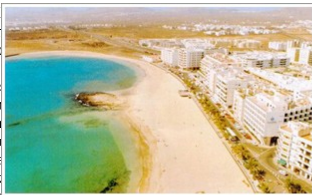
Slika Št.11: Playa de

Velikost otoka je 795 km 2 . Ima 80 000 prebivalcev. Lanzarote je največkrat označujejo z besedami poleg čudovitih peščenih plaž in sonca v ne zanimivega. Kakor vsi otoki Kanarskega zemeljskega površja, ki se je dvignilo z morja. Toda tukaj so vulkanski izbruhi in izvirne katastrofe, povzročili, da je pokrajina ne le narodni park Timanfaya področje, ki ga turisti občudujejo nastalo podgorje Montanas del Fuego (Ognjena četrtina najrodovitnejših površin otoka je prekrita ljudem ni preostalo drugega, kakor da zapustijo otok. vulkanske skale iz tega obdobja so vse različnih barv, oblik, tekstur in velikosti. Kraterji so črni, rdeči in sivi. Polja pa prekrivajo nazobčene skale, visoke kakor človek, sivi grušč in ponekod bogata vulkanska plast omogoča presenetljivo raznovrstno poljedelstvo. Naravna vegetacija je redka, od dreves rastejo le palme in tamariske. Ljudje živijo v majhnih naseljih, v belih hišah s čebulasto oblikovanimi dimniki in urejenimi vrtovi s črno vulkansko prstjo, ki so videti kakor asfaltirana parkirišča. Vasi so raztresene po otoku povsod, kjer je mogoče obdelovati zemljo. Proti severu se otoška pokrajina hitro vzpenja, nato pa se nenadoma spusti v strmih skalnatih stenah do morja, iz katerega se dvigajo še trije otoki: Isla Graciosa, Isla de Montana Clara in Alegranza. Zahodna