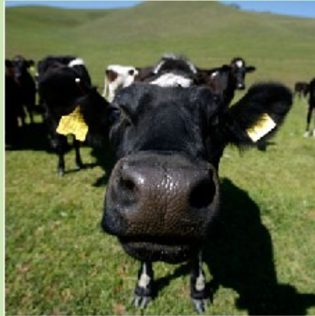
Travniki in pašniki