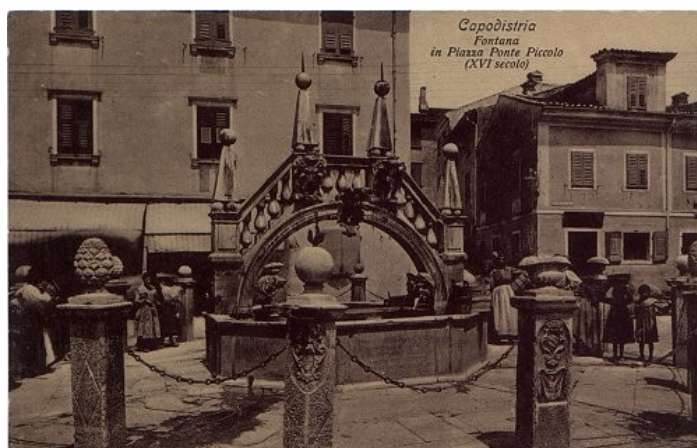
da pontejev vodnjak