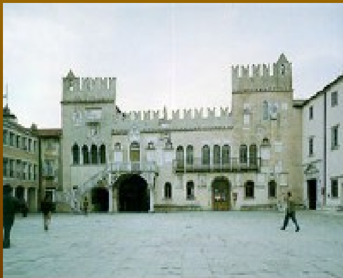
Pretorska palača Stolnica