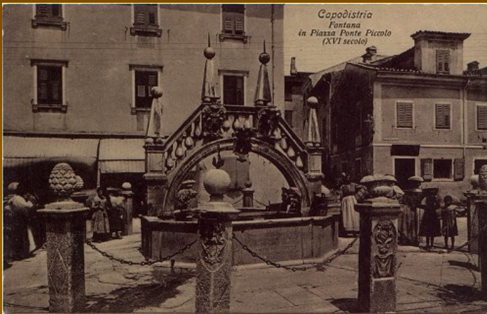
Da pontejev vodnjak