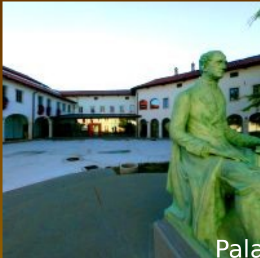
Palača Carli Kapodistriasov trg