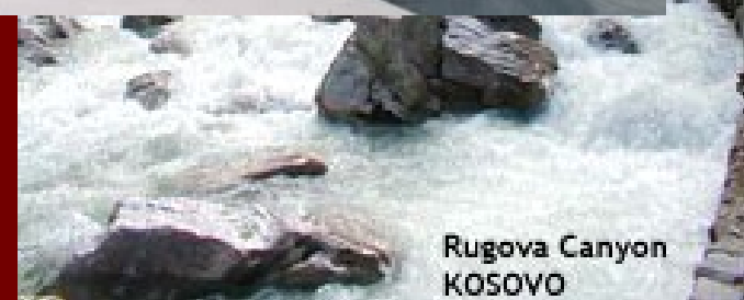
Rugova Canyon KOSOVO