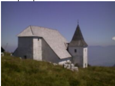
Cerkev sv. Uršule na Uršlji gori.