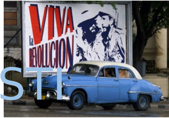
Tovrstnih lepotev na Kubi ne manjka.

Prvi prebivalci tega otoka, ki so se nanj naselili leta 3500 pred našim štejetjem, so se imenovali Indijanci TAINO. Kmalu so ti prvotni prebivalci izumrli, saj so se na otok začeli naseljevati Španci.