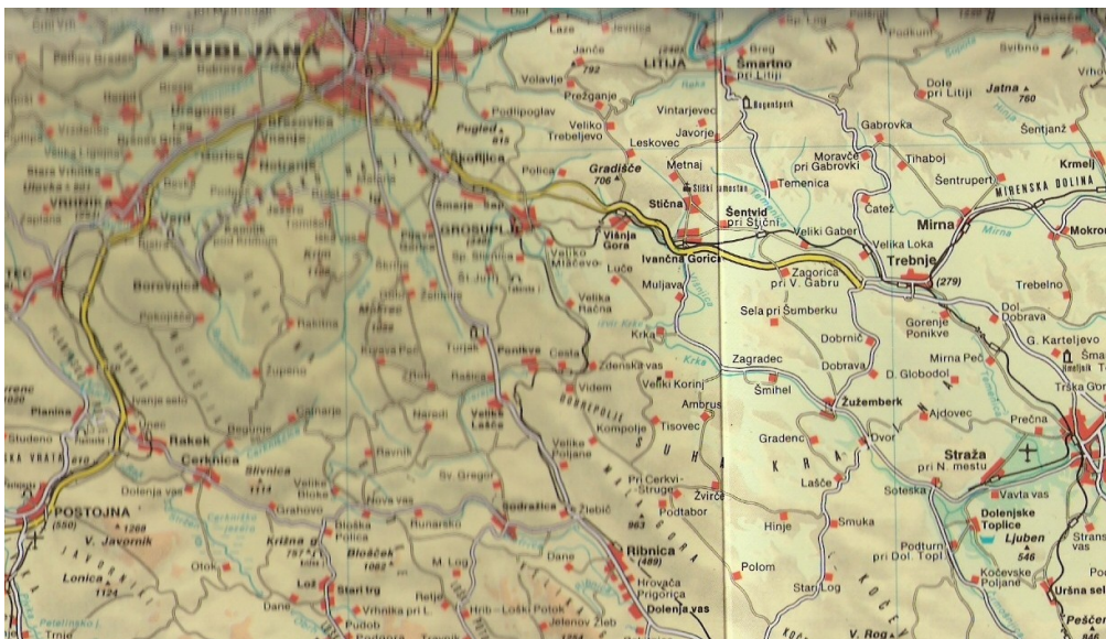
Slovenija šolski namizni topografski in nemi zemljevid merilo 1.5000000

Litja leži v predalpski Sloveniji ob reki Savi. Na vzhodu je Posavsko hribovje, severno od nje leži vas Vače, južno od nje leži Šmartno pri Litiji na zahodu pa Kresnice.