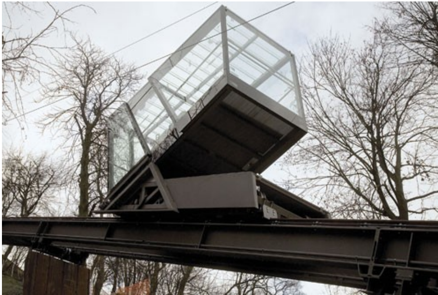
Vožnja z vlakcem