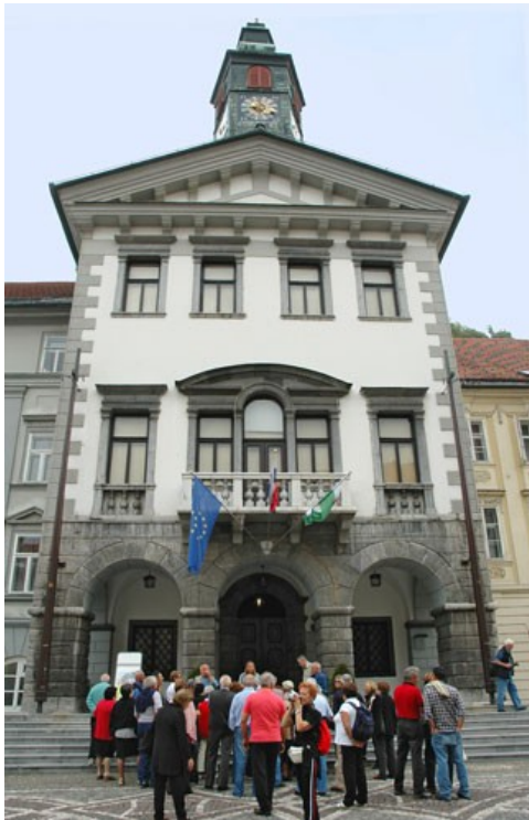
Sprehod po Plečnikovi Ljubljani