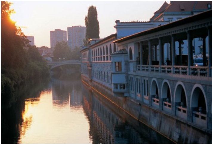
Po Prešernovih Stopinjah