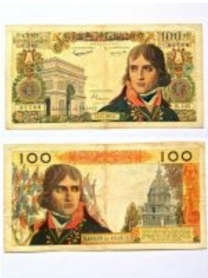
PRVI DENAR-MALTEŠKA LIRA