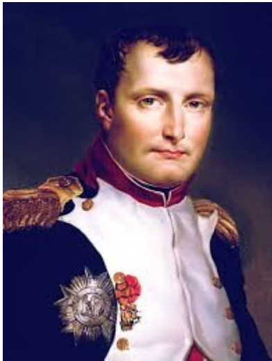
SLIKA PODOBE NAPOLENA