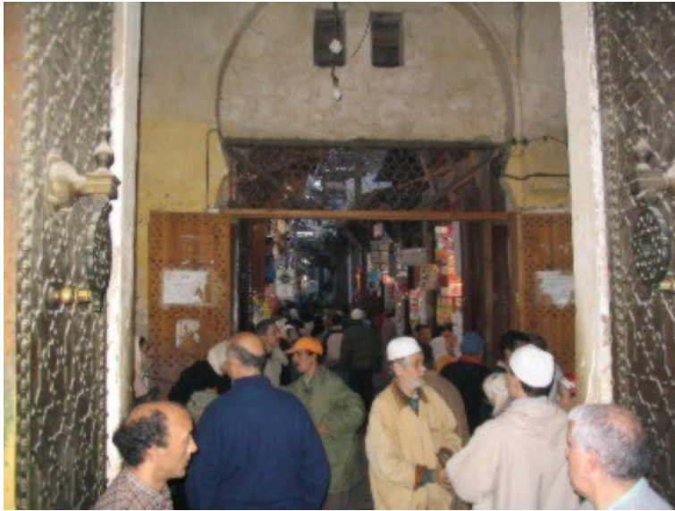
Ozke uličice Fesa

Uradna religija v Maroku je islam, 99% prebivalcev je muslimanov. Gre za sunite in ne šiite, ki so razširjeni v Alžiriji in s katerimi običajno povezujemo islamske skrajneže. Kljub temu, da življenje poteka v skladu z verskimi običaji, je Maroko ena izmed najbolj nepredanih arabskih držav, kar se tiče religije. Maročani tako na primer lahko uživajo alkohol, ki je strogo prepovedan le tekom ramadana.