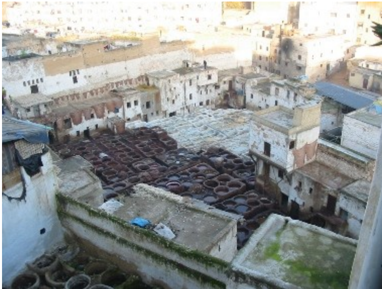
Feška klasika – tovarna usnjenih izdelkov