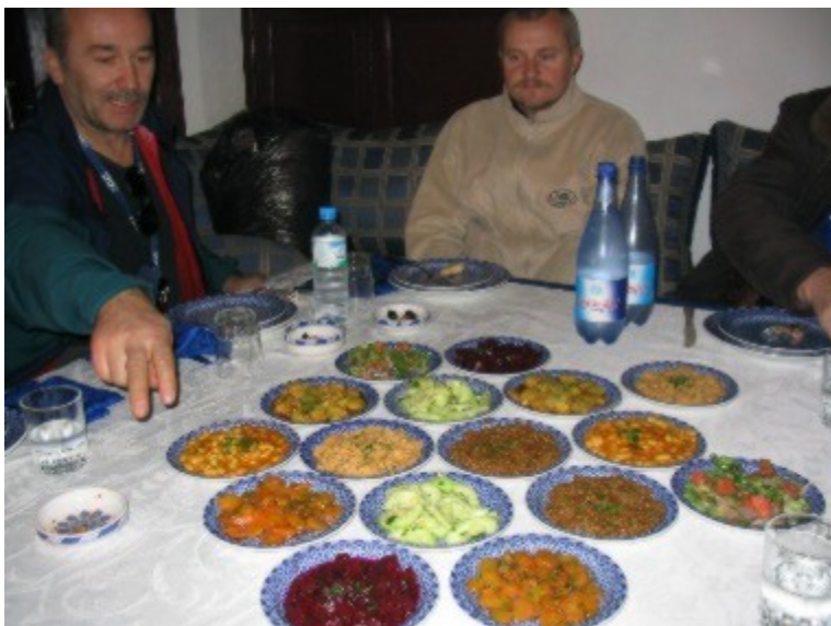
Predjed za večerjo

Za Maročana je velika čast, če človeka, ki ga ima za iskrenega in pravega prijatelja, povabi na kosilo. Še bolj pa je počaščen tisti, ki je povabljen. To ni navadno kosilo, saj gre za cel obred v čast gostu.