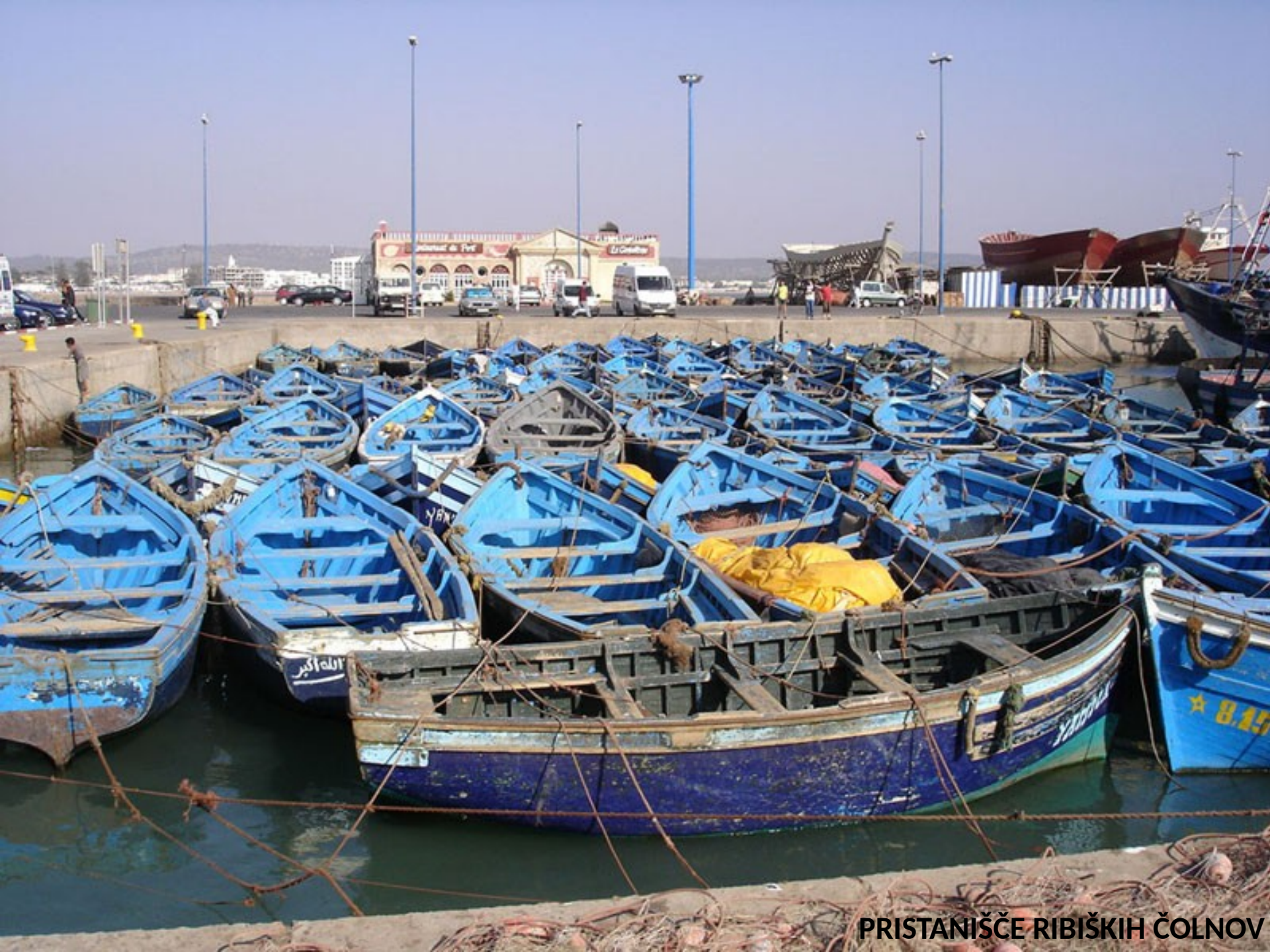
PRISTANIŠČE RIBIŠKIH ČOLNOV