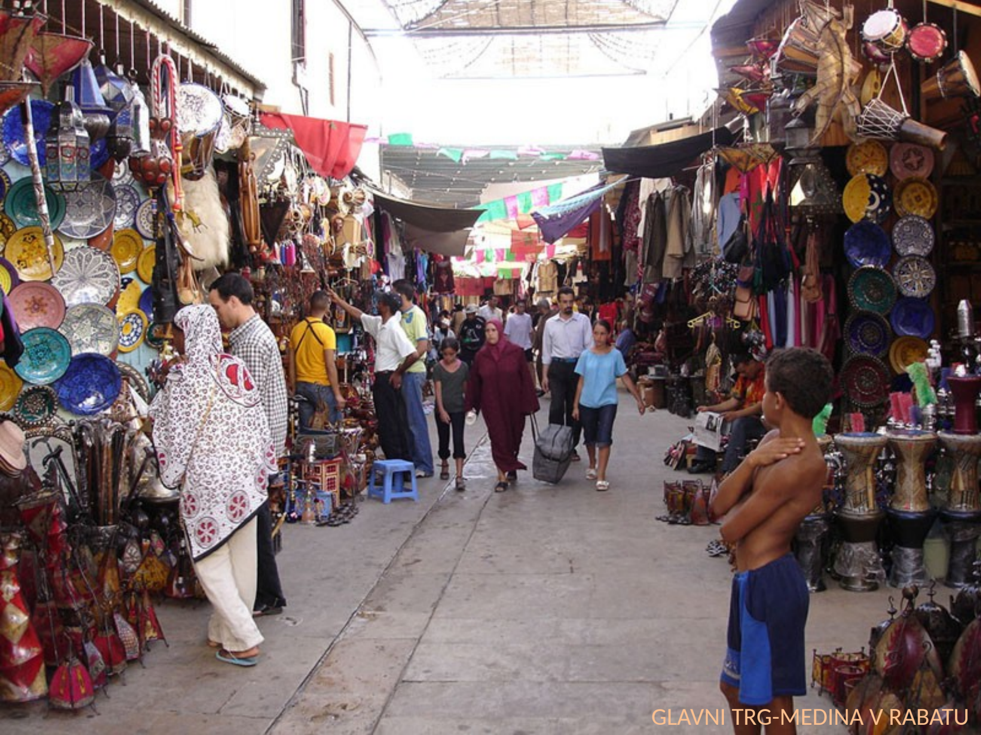
GLAVNI TRG-MEDINA V RABATU