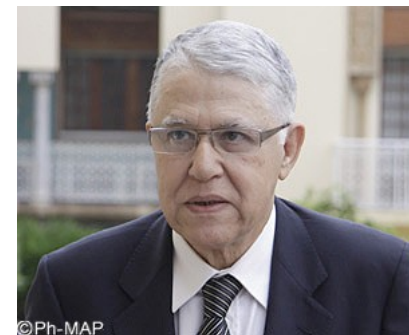
ABBAS EL FASSI