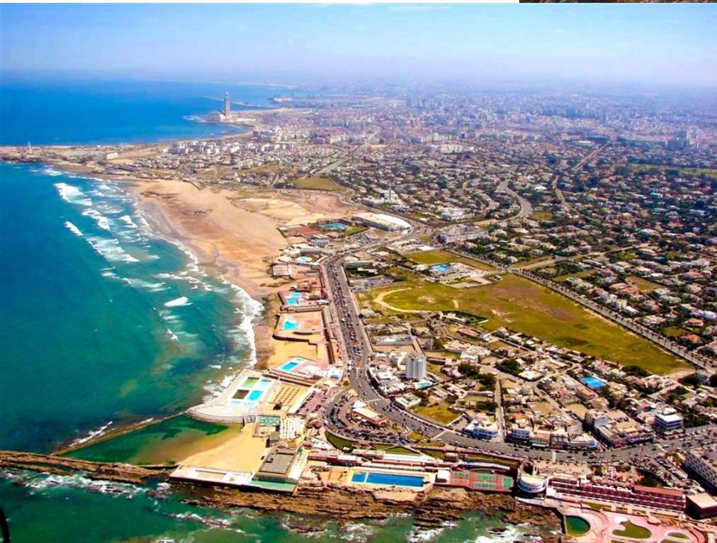
NAJVEČJE MESTO V MAROKU-CASABLANCA

KLJUB TEMU DA JE RABAT GLAVNO MESTO MAROKA NI NAJVEČJE V DRŽAVI. NAJVEČJE MESTO TE DEŽELE JE CASABLANCA.