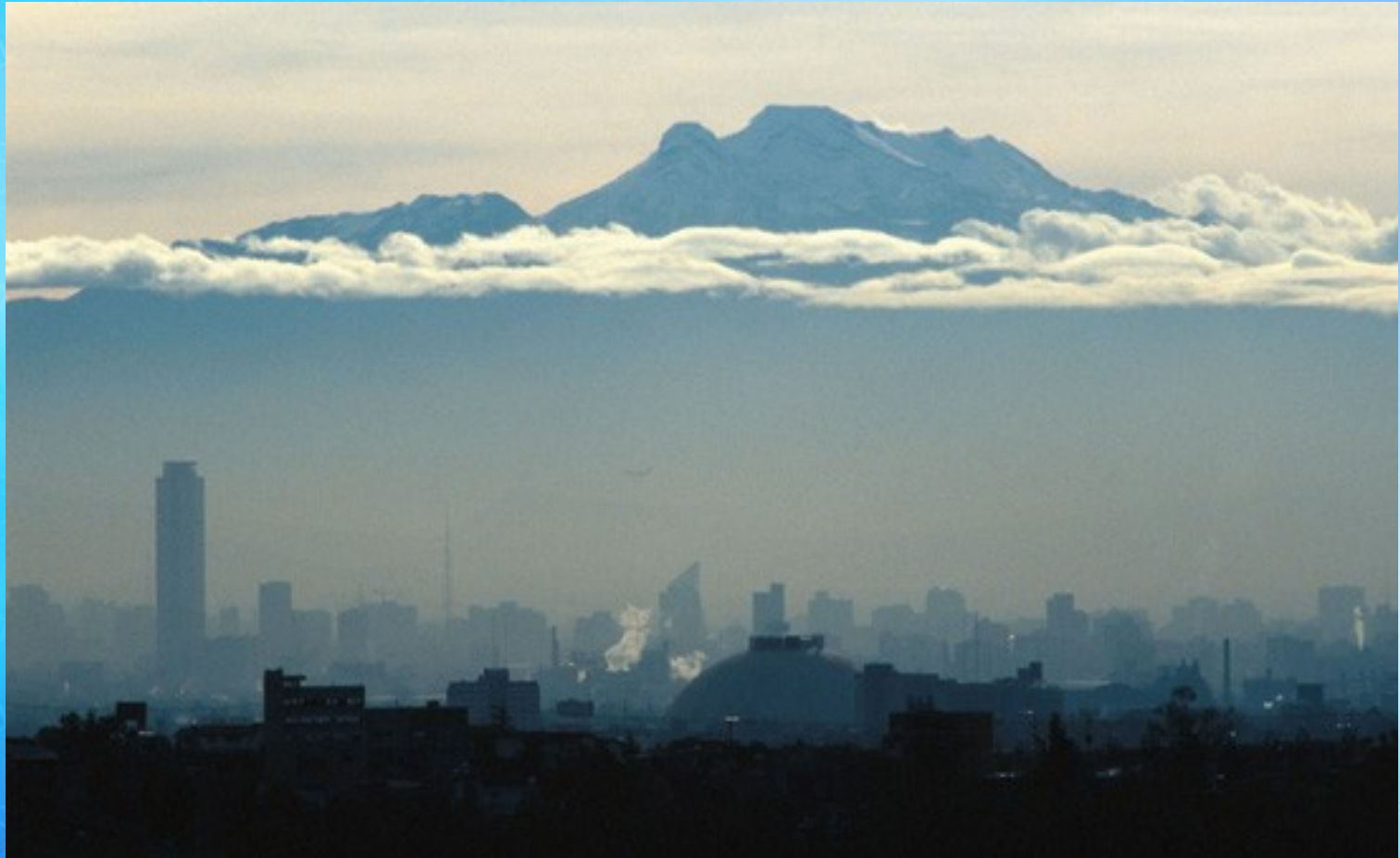
Smog v Mexicu