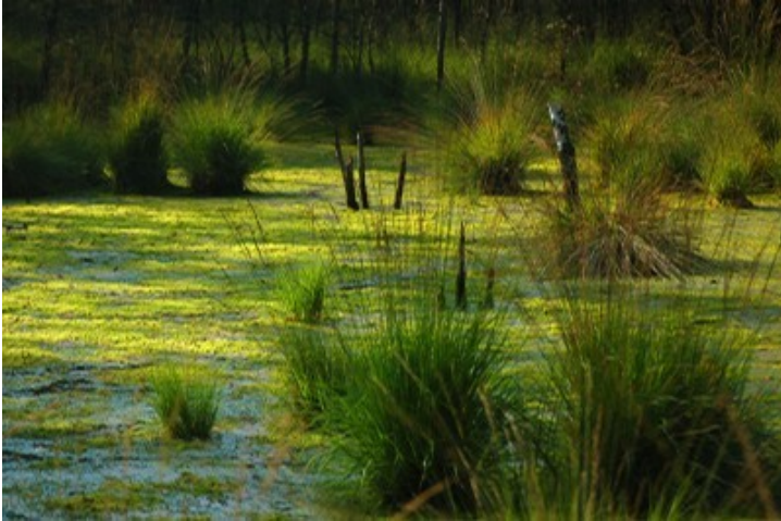
Mokrišče oz. močvirje

imajo značilnosti kopna in vode, ki se med seboj prepletata, ali povezujeta. Mokrišča so območja močvirij, nizkih barij, šotišč ali vode, naravnega ali umetnega nastanka, stalna ali občasna, s stoječo ali tekočo vodo. Mokrišča varujejo okolico pred poplavami, čistijo onesnažene vode, je vir hrane, ter prostor za počitek.