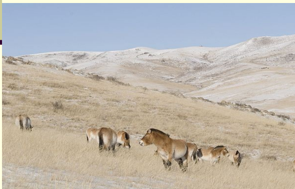
Konji v Mongolski stepi