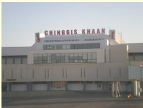
Letališče Chinggis Khaan