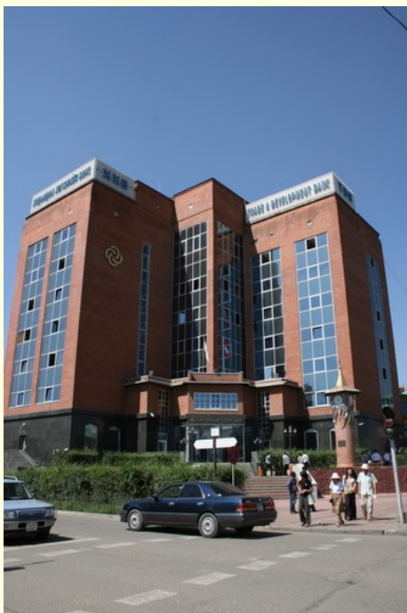
Trgovsko bančni center