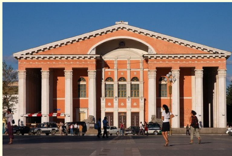
Nacionalno gledališče, opera in balet