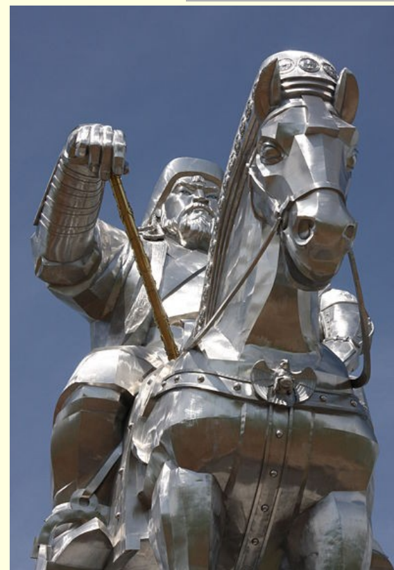
Džingiskanov kip je najvišji kip na svetu, visok je 40 m