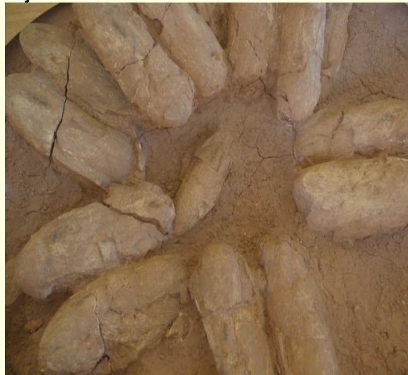
Skelet Tiranosaura in njegova jajca shranjeni v prirodoslovnem muzeju v Ulan Batorju