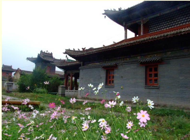
Budistični hram v Ulan Batoru