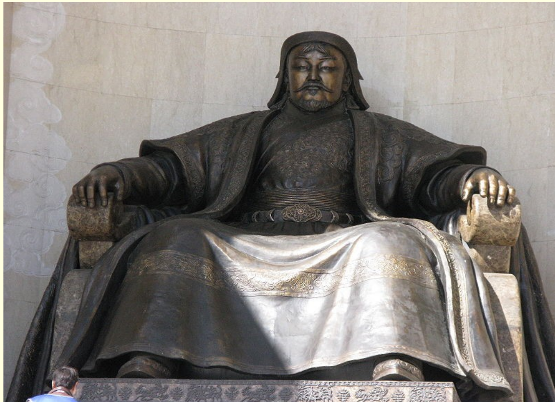
Džingiskanov kip pred palačo mongolskega parlamenta v Ulan Batorju