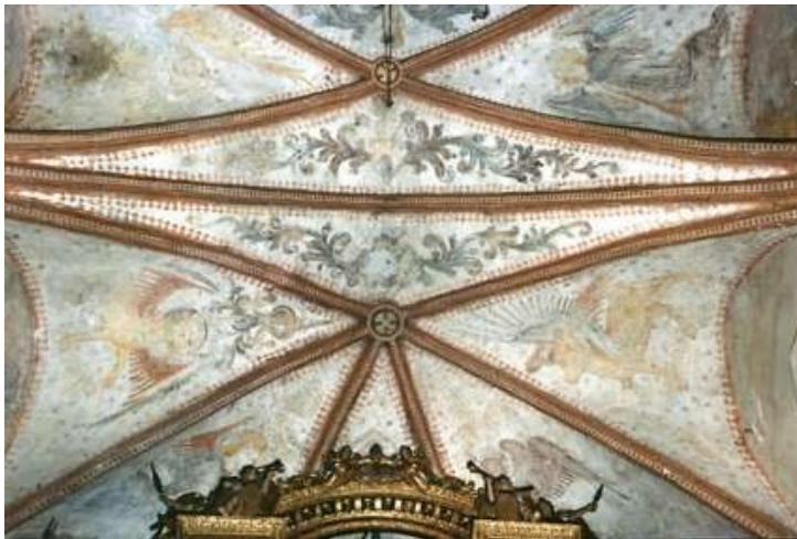
Freske nad glavnim oltarjem