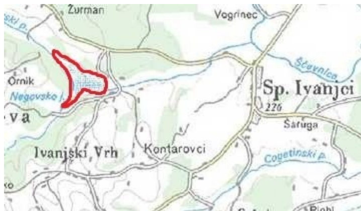
SLIKA 7 : JEZERO