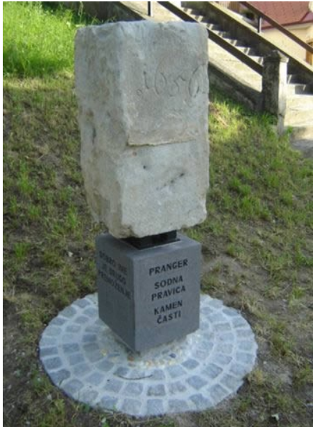
Slika 5: Pranger