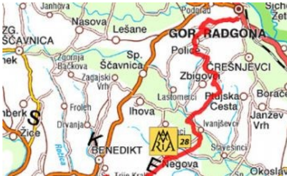
SLIKA 1 : ZEMLJEVID

Je sedež istoimenske krajevne skupnosti, ki spada v občino Gornja Radgona. Krajevna skupnost obsega osem naselij, ki ležijo v treh različnih reliefno-geografskih enotah. Od jugozahoda proti severovzhodu, si sledijo naslednja naselja: Kunova, Negova, Lokavci, ki ležijo na desni strani reke Ščavnice in spadajo v osrednje Slovenske gorice, v večjem obsegu na dnu Ščavniške doline ležijo Radvenci, Ivanjševci ob Ščavnici in Gornji Ivanjci, med tem ko Ivanjševski Vrh in Rodmošci ležijo na južnem delu Radgonskih Goric. Tako se na tem prostoru stikajo tri mikro-geografske enote, ki so del večje regije, imenovane Slovenske gorice.