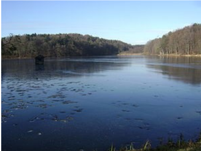
SLIKA 8 : JEZERO