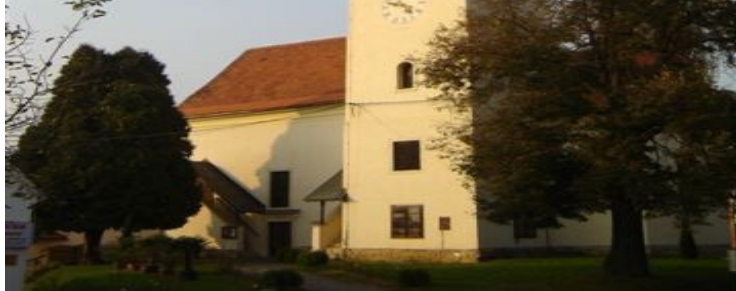
Slika 6: Cerkev