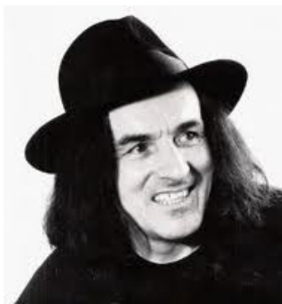
SLIKA 9: Ivan Kramberger, dobrotnik in politik