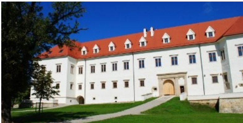
Slika 3: Grad Negova

Eden izmed najpomembnejših kulturnih spomenikov ne samo v kraju Negova, ampak tudi v Slovenskih goricah je grad.