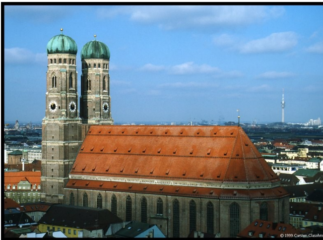
Slika 3: Cerkev naše gospe ( Frauenkirche ) in Olimpijski stolp v Munchnu

Bavarske Alpe mejijo na Avstrijo. V Bavarskah Alpah se nahaja tudi najvišja gora v Nemčiji – Zugspitze.