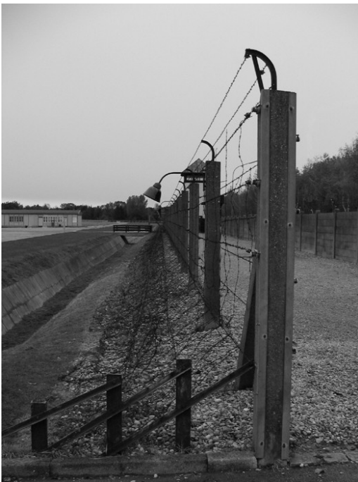
Slika 6: Ostanke nacističnega taborišča

Prav kmalu po svoji ustanovitvi leta 1933 je Dachau zaslovel kot sinonim za nebrzdano okrutnost. Esesovci in gestapovci so v njem zagrešili neštete zločine. Jehovove priče, homoseksualci, emigranti, Romi, umsko in telesno prizadeti so bili v prvih letih deportirani v Dachau.