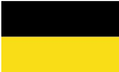
Slika 2: Zastava

Donava izvira v Baden-Württembergu blizu Donaueschingna in v Furtwangnu v Črnem gozdu.