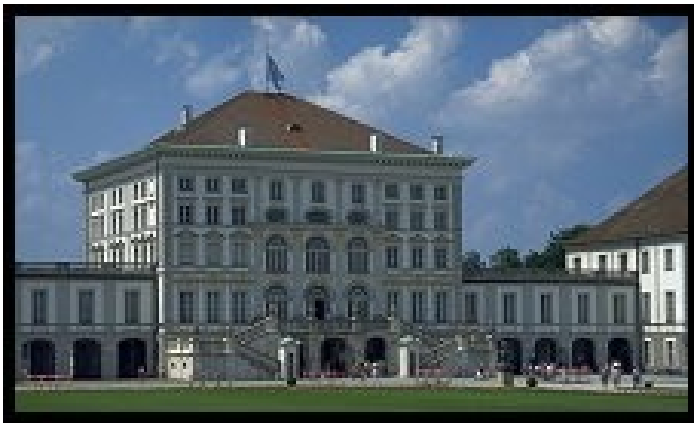
Slika 1: Botanični vrt v Munchnu

V tem referatu se bom osredotočila na Južno Nemčijo, ki jo sestavljata zvezni državi Bavarska ( Bayern ) in Baden Württemberg.