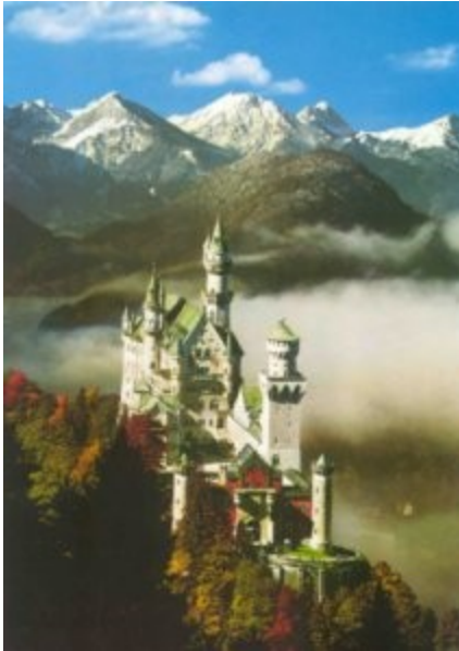
Slika 7: Neuschwanstein

Vredno ogleda je star del mesta, med drugim cerkev Sv. Lorenca in Sv. Sebald, stare mestne hiše, hiša Alberta Dürerja. Zelo znan je Nemški narodni muzej, srednjeveške grajske ječe pod mestno hišo, Muzej igrač idr.