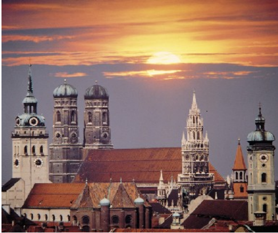
Slika 5: Sončni zahod nad Münchnom

Bavarska prestolnica ob reki Isar je izredno priljubljena zaradi številnih kulturnih prireditev, muzejev, zgodovinskih spomenikov in razgibanega nočnega življenja, obenem pa je to mesto, v katerem se domačini in priseljenci, veliki in mali srečujejo v sproščenem vzdušju ob vrčku piva ... Nič nenavadnega torej, da je večina Nemcev, ki so jih povprašali, v katerem nemškem mestu bi (poleg domačega) najraje prebivali, odgovorila: »V Münchnu!«