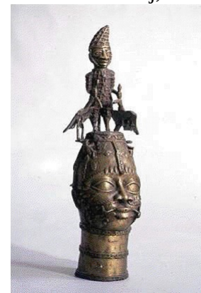
Beninski kralj, bron

Obredna figura plemena Yoruba, zaščitnica plodovitosti in rodovitnosti, Nigerija