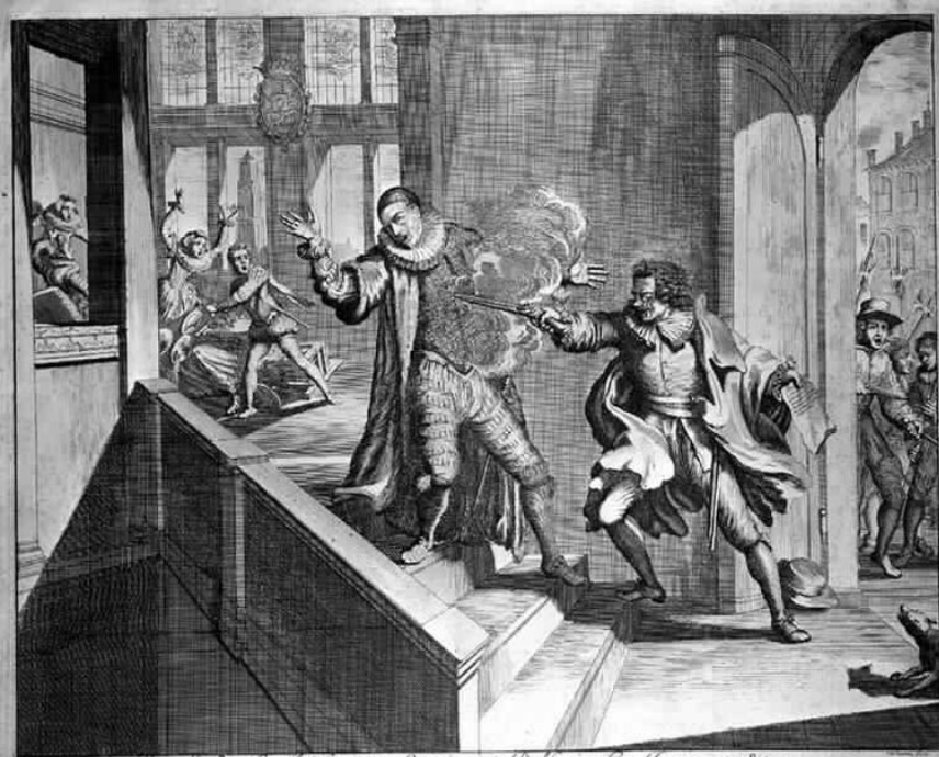
De Moede te Delft van Oranje, tot Delft, in de Hance 1584