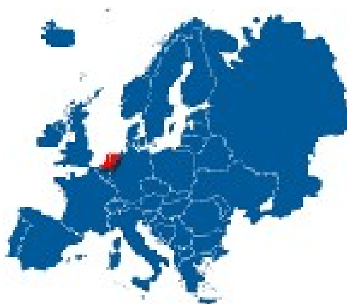
Slika 1 Položaj Nizozemske

Nizozemska (uradno ime je Koninkrijk der Nederlanden, kar pomeni Kraljevina Nizozemska) leži v Z-Evropi in po zadnjih podatkih meri ok. 42. 000 kvadratnih kilometrov . na JV jo obliva Severno morje, na J Belgija in na V Nemčija. Večji del države sodi v Nemško-poljsko nižavje, le na skrajnem J sega v sredogorski svet. Jedro je Holandija, širna pokrajina mokrotnih obalnih ravnin , ki jih od morja loči 5 km širok in do 60 m visok pas visokih peščenih sipin. Na S sipine gradijo dolg niz Frizijskih otokov.