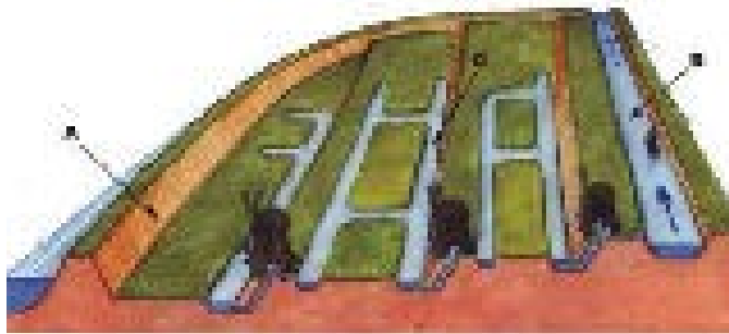
Slika 5: Nastajanje polderja

Polderje, to so polja za nasipi, so prebredli z mrežo prekopov, jarkov in nasipov. Te marše (nižine) ležijo večinoma pod morsko gladino, zato nimajo naravnega odtoka in je treba vse leto umetno uravnati gladino talnice. Včasih so bili temu namenjeni mlini na veter.