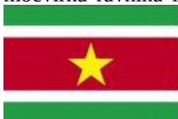
Slika 4 Zastava Surinama

Surinam leži na S. delu J. Amerike, na obali atlantskega oceana. Ob obali je 40-80 km široka močvirna ravnina iz ilovnatih in peščenih naplavin; deloma leži pod morsko gladino in je oplovnimi nasipi. Proti notranjosti se postopoma dvigne v rahlo valovito se dvigajo granitni osamelci. J. del sega v nizko hribovje Gvajanskega s številnimi rečnimi dolinami.