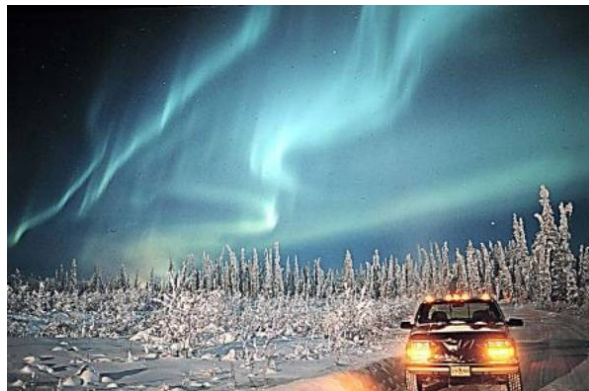
Slika 7: polarni sij