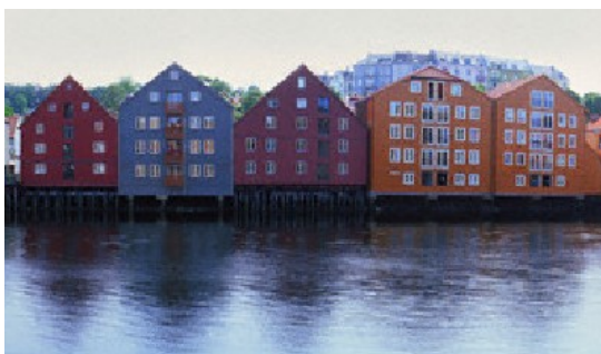
Slika 4: pisane hiške