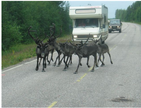
Slika 6: severni jeleni na cesti