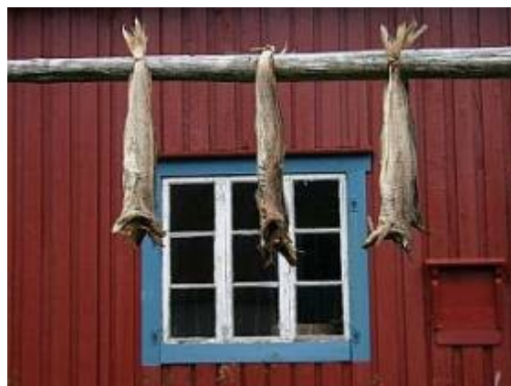
Slika 8: sušenje rib