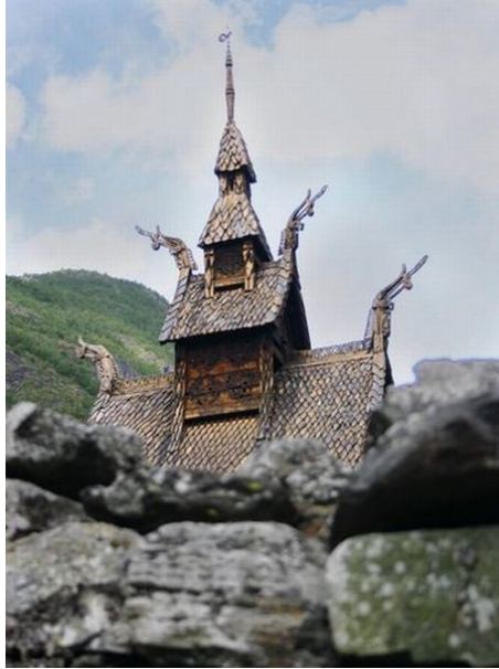
Slika 9: vikinška hiška