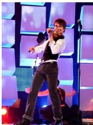
Slika 5: Alexander Rybak