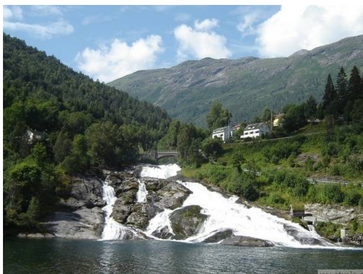
Slika 3: Fjord Geiranger