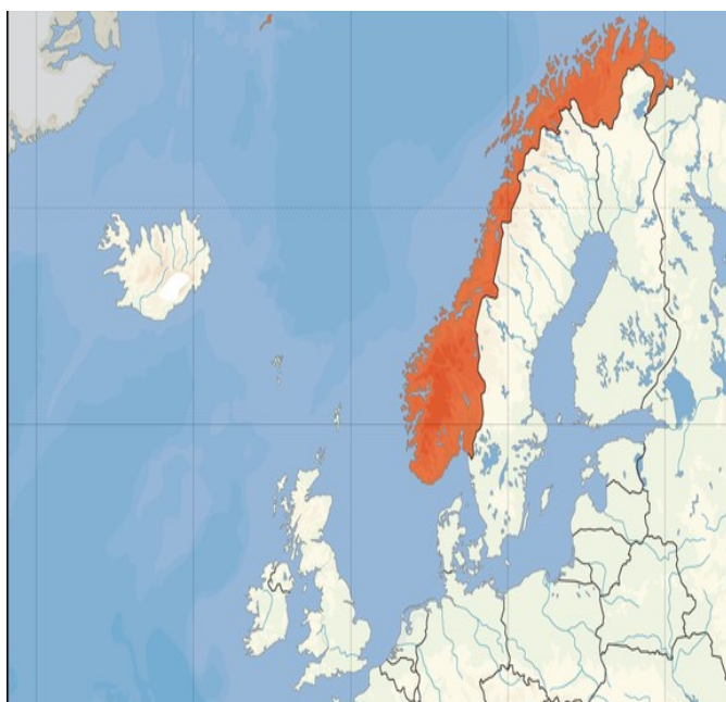
Slika 1: Norveška

Norvežani skrbijo za ohranitev narave, so zelo odprti in pošteni, sledijo nepisanim pravilom, predvsem pa svoji vesti. Država je poznana kot najmiroljubnejša država na svetu. V trgovinah nimajo nobenega nadzora, v javnem prevozu nihče ne pregleduje vozovnic, na oknih nimajo zaves in celo kraljeva palača je brez ograje. Zelo razvit imajo sistem socialnega varstva, oblasti pa se trudijo omejiti število brezposelnih, prostitutk in narkomanov.