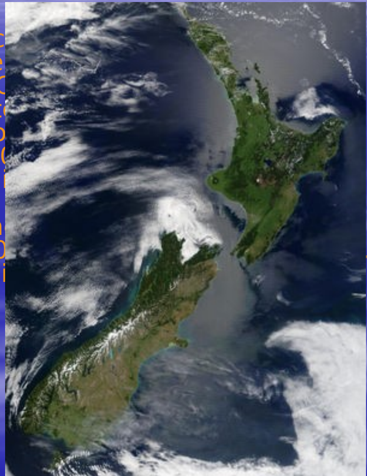
Satelitska slika Nove Zelandije.

Nova Zelandija je nekako osamljena v oceanu. Glavna otoka, splošno znana kot Severni otok, ločuje v pliocenu nastali 23 km širok Cookov preliv od Novi Zelandiji tudi številni manjši otoki, kot so Stewartov otok, otočje Bounty, Antipodski otoki. Celina Avstralija je oddaljena okrog 2.000 km od glavnih otokov. Južno od Nove Zelandije so Nova Kaledonija, Fidži in Tonga. Nova Zelandija je naravno bogata, kar 80% prebivalstva živi v mestih. Večina dežele prekrivajo gozdne površine, 50% pa je namenjena za 20 odstotkov pa je obdelovalne površine.