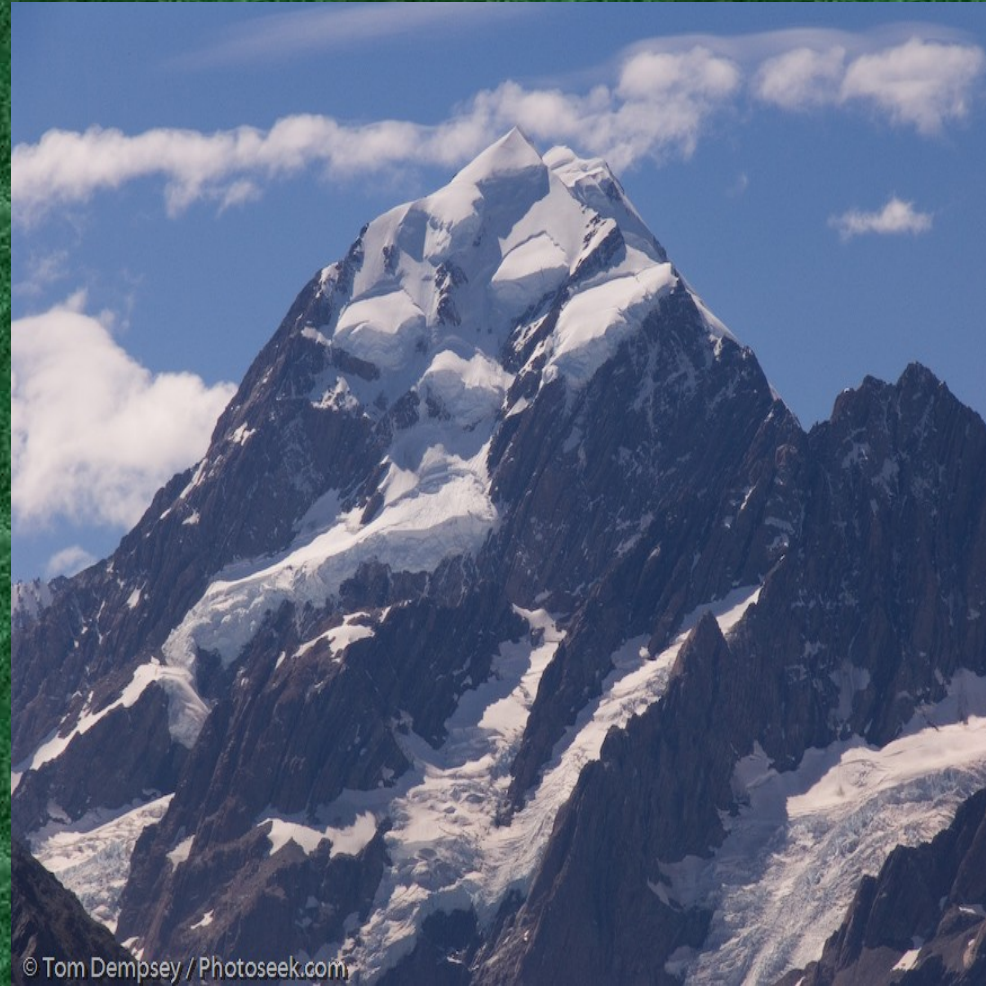
Mount Cook 3754 m