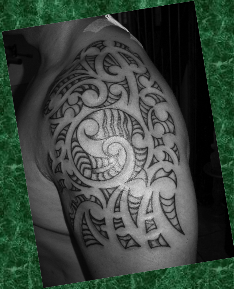
Tetovaža Ta moko