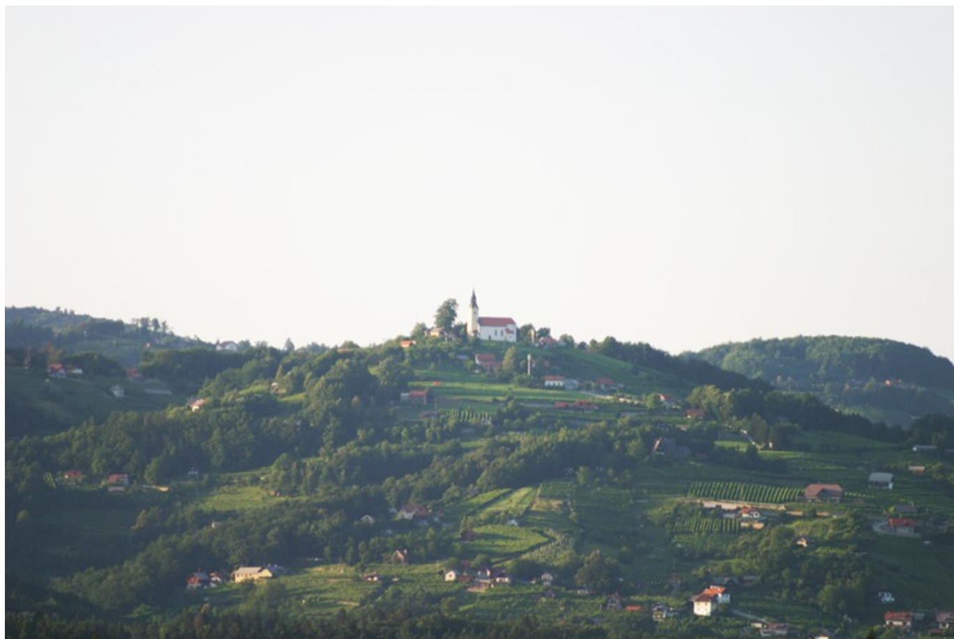
Slika 7 – Trška gora

Novo Mesto leži sredi gričevnate pokrajine ob reki Krki na nadmorski višini 190m. na jugovzhodu Gorjanci(planota), na jugozahodu Ljuben (546 m), na zahodu vzrastki Kočevskega Roga, na severu pa Trška gora (428 m).