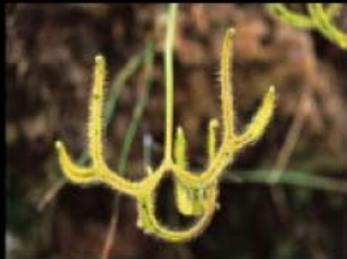
Drosera binata var. dichotoma