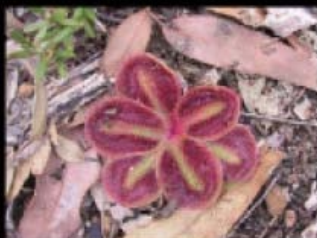
Drosera cyathophylla subsp. squarrosa