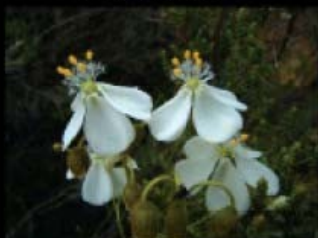
Drosera maculata subsp. maculata