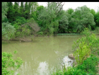
mrtvica ob Muri