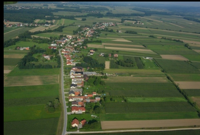
dolga obcestna vas