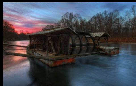
Babičev mlin ob Muri

*Mrtvice so rokavi rek, opuščene rečne struge z zastajajočo vodo in so pravo nasprotje deročih rek. Rastlinstvo in živalstvo mrtvic je izredno bogato. Ob vsaki poplavi reke mrtvica oživi.