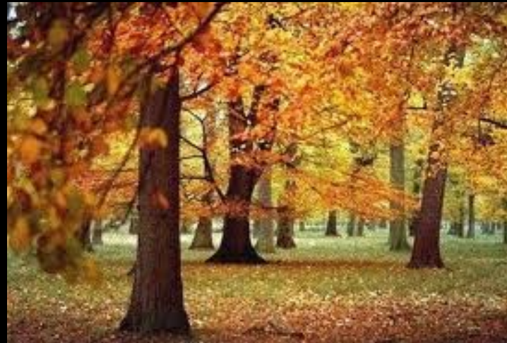
primer listnatega gozda