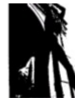
Baročna vrata sv. Jurija

Piran je slikovito obmorsko mesto na skrajnem zahodnem rtu Slovenske Istre, pomembno pomorsko, ribiško in kulturno središče in Letovišče. Tako kot ostalim krajem, daje Piranu pečat sredozemsko podnebje s toplimi poletji (julij, povprečno 23,2 stopinj Celzija) in blagimi zimami (januar, povprečno 5,7 stopinj Celzija). Bujno sredozemsko rastlinje - ciprese, fige, kakiji, oljke pinije in nešplje ter značilna arhitektura krasijo okolje piranske občine.