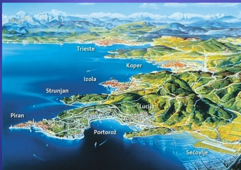
Lega Pirana v obalni regiji. Sloveniji.