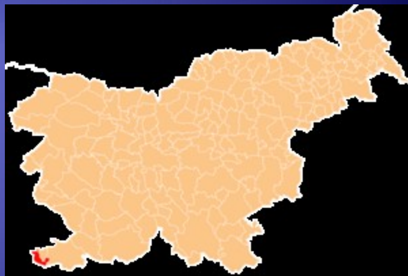
Lega Pirana v