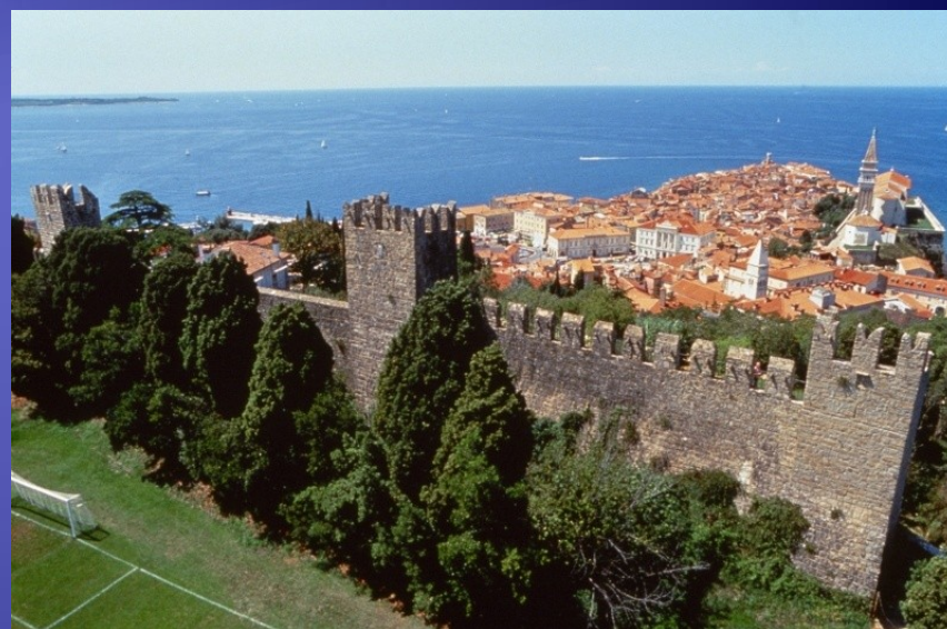
Mestno obzidje Pirana.