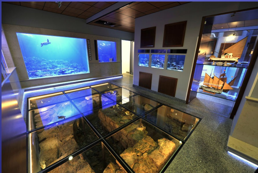
Piranski akvarij trgovine Solnce