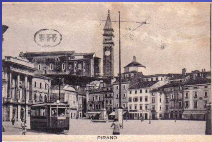
Piran včasih, ko so imeli še tramvaj.