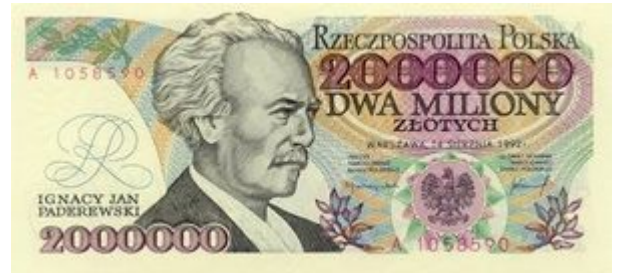
denarna valuta Republike Poljske,

-Površina: skupaj 312.685 3 km 2 , voda 2,65%, površina 97,35%