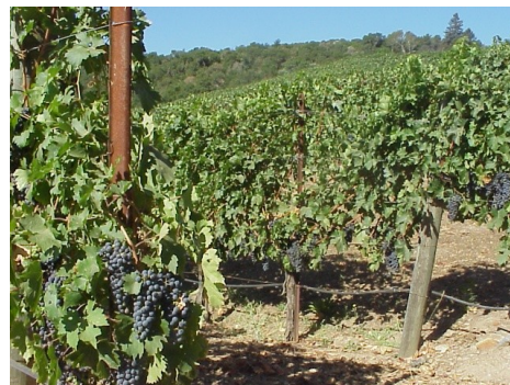
Slika 4: Vinograd

Kmetijsko dejavnost Koprskih brd v primerjavi z večino drugih slovenskih pokrajin označuje cel niz posebnosti v načinu obdelave s prevlado ročnih tehnik na kulturnih terasah in v rabi tal, kjer so bile močno prisotne sredozemske kulture: vinska trta, oljka, murva, zgodnja zelenjava, smokva itd. poglobitna kultura je bila vsekakor vinska trta, zlasti na zahodu, najmanjših nadmorskih višinah ter na južnih in zahodnih pobočij, splošno razširjena pa je bila tudi drugod. Še leta 1900, po hudi škodi, ki jo je v osemdesetih letih prejšnjega stoletja povzročila filoksera, so vinogradniki pokrivali 13 % vseh površin.