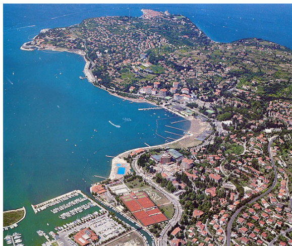
Slika 3: Portorož