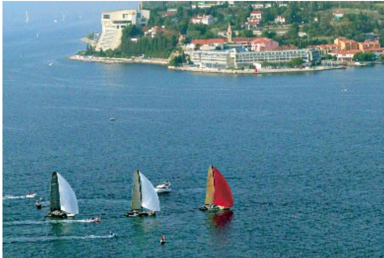
Slika 2: Poletne aktivnosti v Portorožu

Portorož s svojim subtropskim podnebjem sodi med najtoplejše predele Slovenije. Veliko je sončnih dni. Padavin je malo, med 1000 in 1100 mm letno. Značilne so mile zime, temperatura se le redko spusti pod ničlo in ne prevroča poletja.