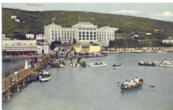
Slika 4: Portoroški hotel v starih časih

Danes je Portorož priljubljen kraj tako za delo, kot za oddih in zabavo. O tem priča množica udobnih hotelov z modernimi bazeni, pestra ponudba restavracij in prireditve, ki privabljajo obiskovalce. Portorož je tudi priljubljeno kongresno središče. Je pa tudi zelo znano po sedežu splošne morske plovbe, ki je uredil tudi svojo muzejsko zbirko.