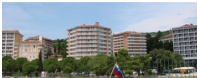
Slika 6: Portoroški hoteli

Grand hotel Metropol in igralnica Casino, Grand hotel Palace, Grand hotel Emona, Avditorij – večnamenska dvorana za kongrese, Turistično naselje Bernardin, Zdravstveni dom Lucija, cerkev Device Marije Rožnovenske