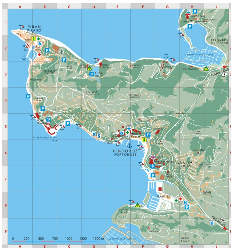
Slika 1: Karta Portoroža

Tam, kjer se Tržaški zaliv kot sestavni del Jadranskega morja najbolj približa osrčju Evrope leži slovenska Obala in Portorož. Slovenska obala meji na dve državi sosedji: čez morje in po vzhodnem robu meji na Italijo, na južnem pa na Hrvaško. Po identifikacijski metodi velikih evropskih mest bi lahko dejali, da se Portorož nahaja nekje med Benetkami in Dunajem v bližini Trsta. V današnjih komunikacijskih povezavah nedaleč od mest Zagreb, Graz, Salzburg, Muenchen, Budimpešta.