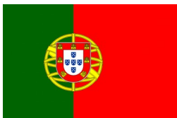
Slika 1: Portugalska zastava.