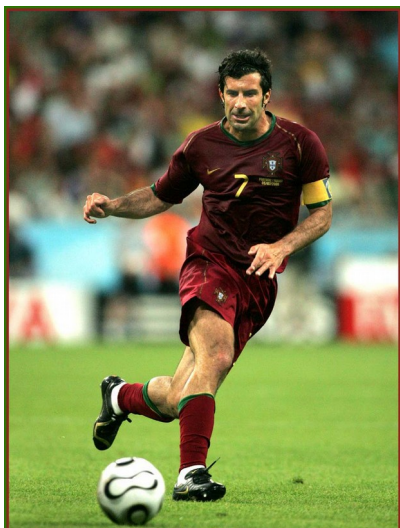
Slika 20: Luis Figo, med igro

Luis Figo, ki se je rodil 4. novembra 1972 v Lizboni, je bil od leta 1995 do leta 2000 izbran za najboljšega portugalskega nogometaša. Prav tako je bil leta 2000 najboljši igralec Evrope, leta 2001 pa ga je FIFA izbrala za svetovnega nogometaša leta. Figo je za državno reprezentanco zbral 110 nastopov in dosegel 31 zadetkov, igral pa je tudi v velikih evropskih klubih, kot so FC Barcelona, Real Madrid in Inter iz Milana.