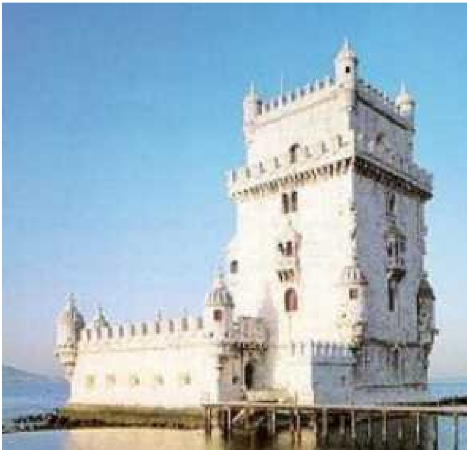
Slika 21: Belemski stražarski stolp v Lizboni.

V Lizboni si lahko ogledaš veliko cerkva z zanimivo zgodovino in zanimivimi predmeti.