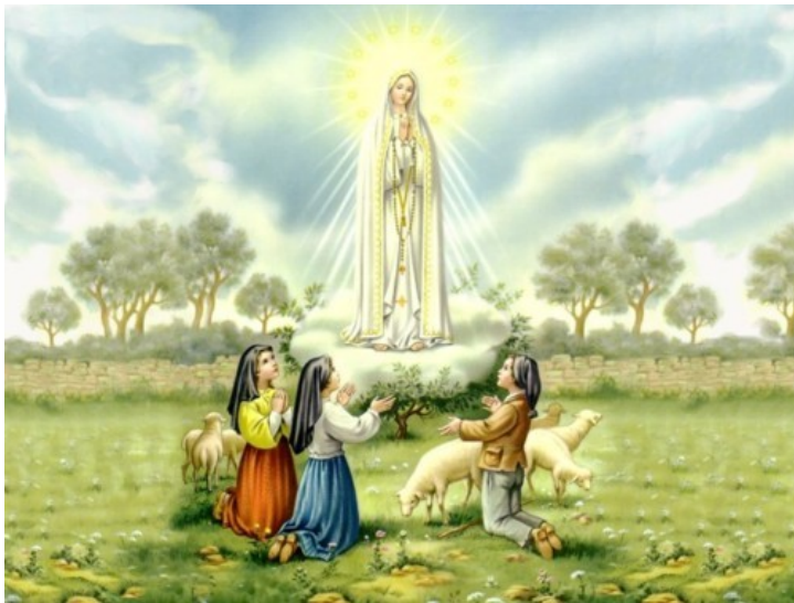
Slika 16: Prikazuje fatimsko Marijo, in tri pastirje, ki so jo videli.

Fatima je bila v času prikazovanj vas, ki leži 125 km severno od Lizbone. Dejansko so se prikazanja dogajala v bližnji dolini. Starši vidcev so bili kmetje, ki so imeli posestva ravno dovolj velika za preživetje. Prikazovanja so se dogajala v času prve svetovne vojne in tik preden se je zgodila slavna oktobrska revolucija. Marija se je hotela še posebej predstaviti svetu, opozoriti na to, da je srednica vseh milosti, tudi vsakršnega miru, da je Kraljica miru.