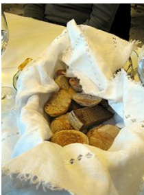
Slika 18: Jed kruhki.

Kruhki , polnjeni s šunko in sirom, strežejo v barih poleg čaja. Pri kosilu ali večerji pa ponudijo kruhke z maslom ali ribjim namazom.