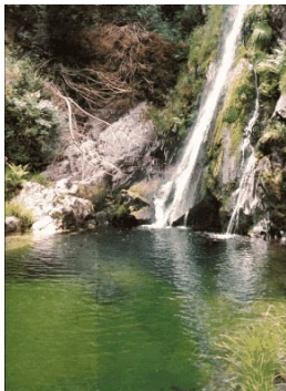
Slika 10: Narodni park

Narodni park Peneda - Geres : Pogorje na SZ Portugalske ponuja nekaj najbolj divjih in nenavadnih prizorov. Posejana je z bodičevjem in pretrgana z globelmi, obrobajo pa jo vrhovi. Skozi park peljejo pešpoti.