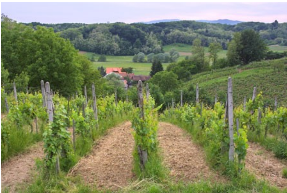
Slika 4: Vinska trta

Tudi turizem je kmalu postal pomembna gospodarska postavka. (Vodnik po Portugalski)