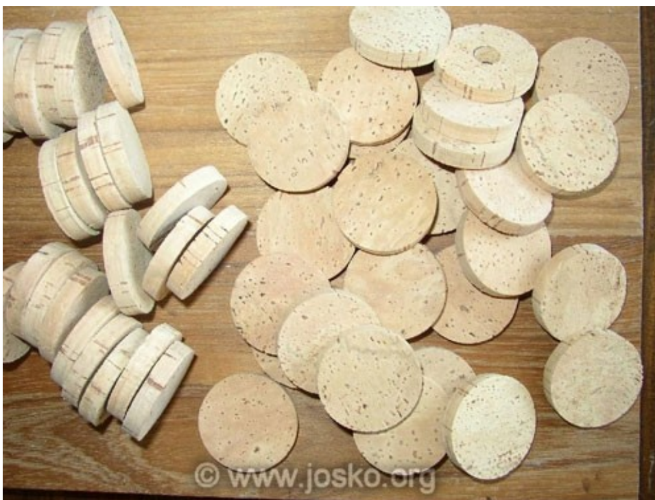
Slika 5: Zamaški iz plute

Portugalska je največja proizvajalka plute na svetu. Plutovci rastejo skoraj po vsej državi, vendar najboljše uspevajo v vročem in suhem alenteškem podnebjju. Odstranjevanje plute s hrasta plutovca je zahtevno opravilo. Ko je skorja dovolj debela (lahko tudi do 10cm) in ko je vreme ravno prav suho, jo z debla in nižjih vej, z lahko sekiro razsekajo na 2-3 m velike dele. Potem jo previdno snamejo z drevesa, saj mora površina pod njo ostati čim manj poškodovana, kajti vsaka brazgotina zmanjša prihodnji pridelek. Plutovec mora biti star vsaj 20 let, da mu prvič posnamejo skorjo, nato pa je spet treba počakati okoli 9 let. Vsak plutovec da od 24 do 45 kg plute. Iz plute izdelujejo zamaške za steklenice, uporablja pa se tudi v letalstvu in pri sistemih klimatskih naprav v jedrskih podmornicah. Zaradi dobrih izolacijskih lastnosti, z njo obložijo tudi posode v katerih prevažajo radioaktivne izotope in druge občutljive snovi. Prav tako jo uporabljamo za oblaganje tal in sten.