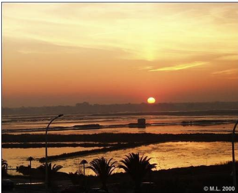
Slika 3: Ria de Aveiro

Portugalska ima dolgo obalo s čudovitimi plažami. Pomembna značilnost je delta Ria de Aveiro s 45 km dolžine in do 11 km širine, bogata z ribami in morskimi ptiči.