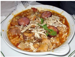
Slika 17: Jed vampi.

Vampi (tripe) so pripravljene precej podobno, kot naši, le da jim Portugalci dodajo koščke svinjine, koščke govedine ali klobase. Vse pa na koncu posujejo s kozjim sirom.