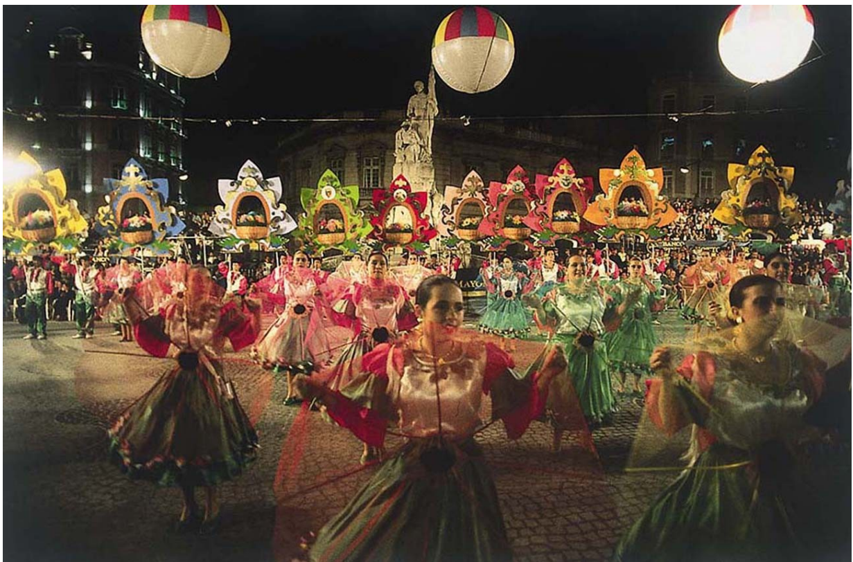
Slika 15: Festas dos Santos Populares

Vsako mesto in vsaka vas ima svoj velikonočni sprevod, najbolj znan med njimi pa je verjetno procesija Ecce homo v Brag. Večina krajev ima tudi enega ali več krajevnih svetnikov; vsakega izmed njih je treba praznovati dostojno in navdušeno. Najbolj znani med njimi so Festas dos Santos Populares v Lizboni, prazniki, ko se svetnikov Petra, Antona in Janeza spominjajo s tremi praznovanji v presledku dveh tednov v juniju.