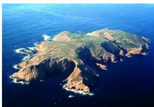
Slika 8: Otoki Berlinga

Otoki Berlenga: So edini otoki vzdolž nerazčlenjene portugalske obale. Na teh skalnatih otočki je možno tudi taboriti in prespati.