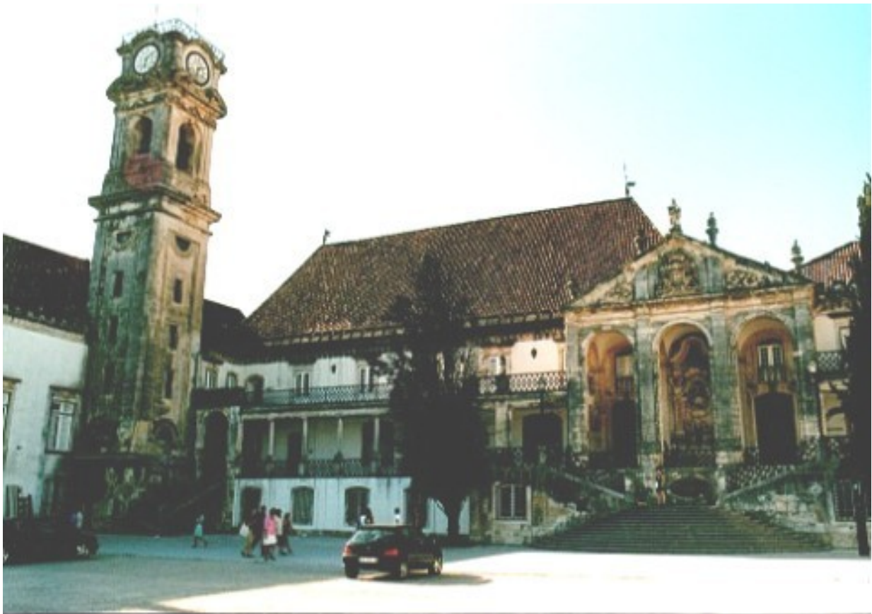
Slika 11: Mesto Coimbra

Zgodovinsko mesto Coimbra se nahaja v središču Portugalske ob reki Mondego. Imenujejo ga tudi mesto študentov, predvsem zaradi ene najstarejših in največjih univerz na Portugalskem - univerze Coimbra, začetke ljudske univerze pa je zaslediti že v 13. stoletju. Danes je v Coimbri najti študente 70 različnih narodnosti. V Coimbri se nahaja tudi veliko zgodovinskih stavb, kot so Stara katedrala, cerkev sv. James, samostan sv. Cruza iz sredine 12. stoletja, Nova katedrala Coimbra iz 17. stoletja, knjižnica Joanina iz 18. stoletja in mnoge druge.