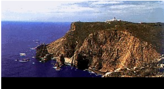
Slika 7: Zahodna obala

Zahodna obala: Na tem predelu je morje hladnejše in tudi vetrovno utegne biti. Toda za tiste, ki so željni samote, je to pravo mesto. Nad obalami se dvigajo strme pečine. Mogočni beli valovi pa privabljajo navdušene deskarje.