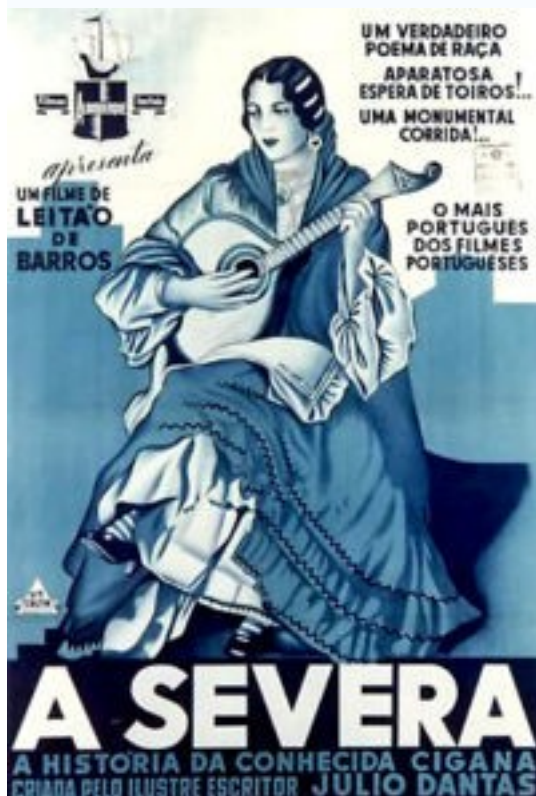
Slika 12: Maria Severa Onofriana

Fado (usoda) je znamenita portugalska glasba, ki so jo zasledili leta 1820, vendar njeni začetki verjetno segajo še bolj v preteklost. Zanja so značilne žalostne melodije in besedila, ki pogosto govorijo o morju in življenju revnih. V glavnem se deli na Lisboa Fado in Coimbra Fado. Prva velik pevka fada je bila Maria Severa Onofriana, ki je živela v prvi polovici 19. stoletja, za največjo pevko Fada, pa velja leta 1999 umrla Amalia Rodrigues. Velika mojstra na kitari pa sta bila Artur Paredes in njegov sin Carlos Paredes.