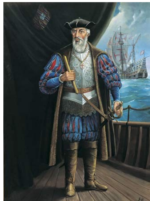
Sliki 13, 14: Portreta Vasco da Gama