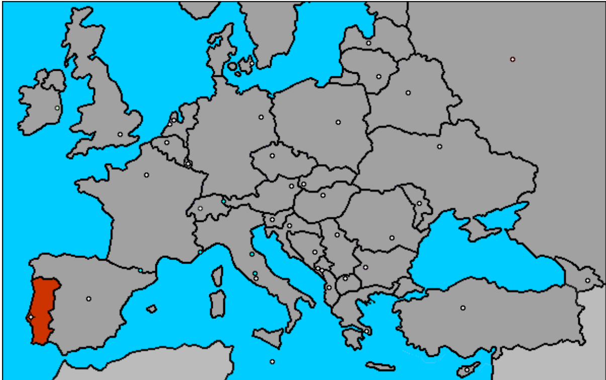
Slika 2: Lega Portugalske.

Portugalska leži na jugozahodnem delu Iberskega polotoka. Na zahodu in jugu meji na Atlantski ocean, na vzhodu in severu pa Španijo. Razteza se v 150 do 200 km širokem pasu južno od pokrajine Minho. (Svet in ljudje)