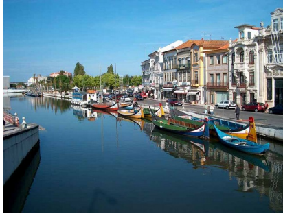
Slika 9: Aveiro Ria

Narodni park Peneda - Geres : Pogorje na SZ Portugalske ponuja nekaj najbolj divjih in nenavadnih prizorov. Posejana je z bodičevjem in pretrgana z globelmi, obrobajo pa jo vrhovi. Skozi park peljejo pešpoti.