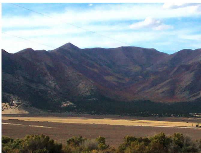
Slika 5: Great Basin

Tla lahko prekriva prst, prst s peskom, kamenje, prod ali samo pesek. Površina tal je izsušena, podpovršinskih vodnih zalog pa ni.