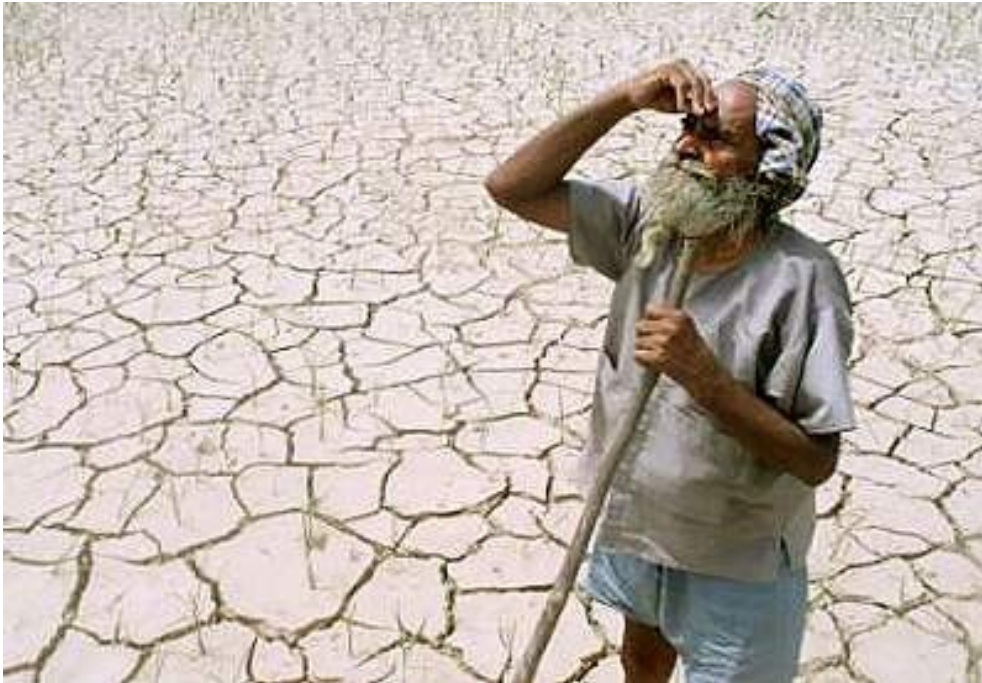
Slika 15: Posledice dezertifikacije