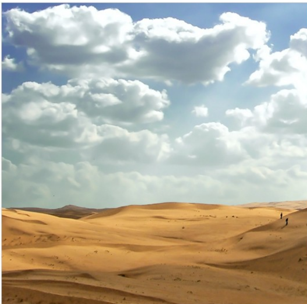
Slika 1: Puščava

V projektni nalogi bom govorila o puščavah in njihovem širjenju. Puščave se mi zdijo zanimive, rada pa bi se naučila še več o njih in opozorila tudi na njihovo nevarno širjenje. Ta tema se mi zdi zelo pomembna za prihodnost Zemlje in s tem tudi za našo prihodnost. S puščavo sem se srečala, ko sem bila na potovanju v Egiptu, zdela se mi je zanimiva in rada bi izvedela ali je puščava le to kar sem videla, ali kaj več.