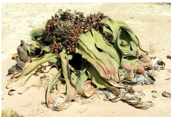
Razcefrani patriarh puščave Namib ( Welwitschia mirabilis ) lahko živi kar 2000

Številni namibski nevretenčarji se hranijo z razpadajočimi organskimi ostanki, ki jih prinašajo vroči vzhodni vetrovi. Drobni delci rastlin ali zrnca organskih snovi se nabirajo v nekakšnih shrambah, v vrzelih med sipinami. Zlasti hrošči se pasejo v teh skladiščih ali zgodaj zjutraj ali pa popoldne, ko se puščavski pesek že ohladi po opoldanski vročini, ki doseže celo 66°C.