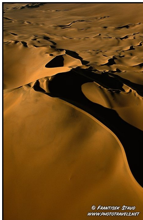
Slika 6: Namib

Količina padavin je večja kot v vročih suhih puščavah.