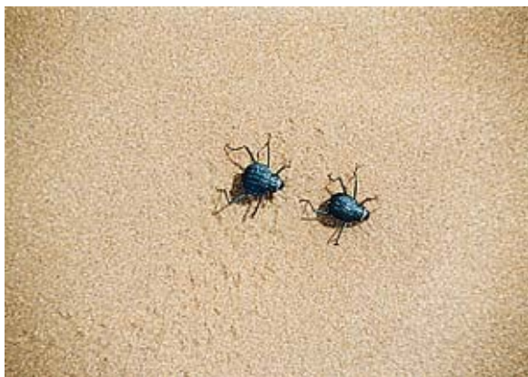
Slika 11: Razcefrani patriarh

let. Bujno rastoča usnjata rastlina je zasidrana v gruščnati zemlji z olesenelo koreniko, ki zraste do 3 m. Korenika kopiči hrano in vodo ter omogoča preživetje v času suše.