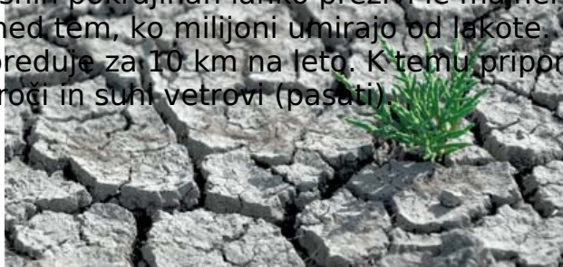
Slika 13: Dezertifikacija

Najbolj kritično stanje je v Sahelu, širokem pasu južno od Sahare, kjer ležijo nekatere najrevnejše države na svetu. S pretirano pašo in z izčrpavanjem revnih prsti je človek uničil skromno rastlinsko odejo in odprl pot puščavi. Prsti na sušnih območjih so izsušene do te mere, da na njih ne uspeva nobeno rastje. Stanje dodatno poslabšuje pretirano pašništvo in čezmerna obdelava zemlje, saj je na ta način uničenih preko 80% kmetijskih površin v Afriki. Rastlinstvo se na revnih prsteh ne more obnoviti in ljudje ne morejo pridelati dovolj hrane za svoje potrebe. V takšnih pokrajinah lahko preživi le majhen delež prebivalstva med tem, ko milijoni umirajo od lakote. Raziskave kažejo, da Sahara napreduje za 10 km na leto. K temu pripomorejo tudi prevladujoči vroči in suhi vetrovi (pasati).