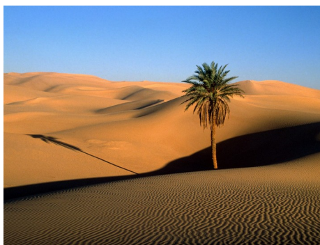
Slika 3: Sahara

Prst je močno peščena in plitva ter razpokana, nima podpovršinskega sloja vode. Zaradi tega rastlinski svet predstavlja le malo rastlin, ki kljubujejo sušam in rastejo v času maloštevilnih deževnih dni ali pa uspevajo le v oazah 1 .