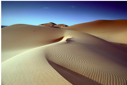
Slika 7: Erg

Peščena puščava ali erg je precej redka oblika puščave. Površje je prekrito s peščeni nanosi, lepo se da opazovati učinke vetrne akumulacije. Najbolj znan je Veliki zahodni erg v Alžiriji.