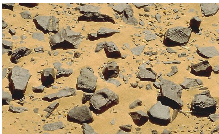
Slika 8: Serir