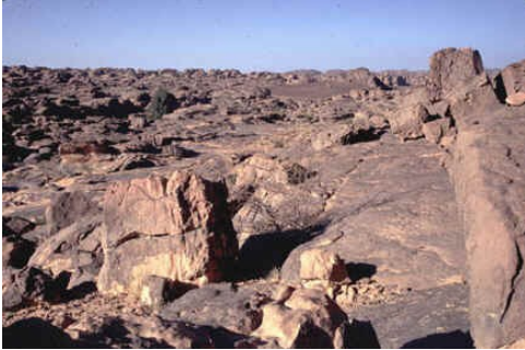
Slika 9: Hamada

Skalne puščave oz. hamade ponavadi nastanejo v bolj goratem svetu. Tu najdemo le zbrušeno golo skalovje, s katerega je veter odstranil ves fini material.