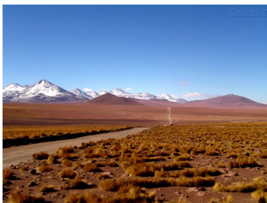
Slika 4: Atacama

Prst hladnih puščav je težka, zbita, muljasta in slana.