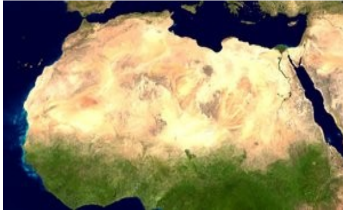
Slika 2: Satelitski posnetek