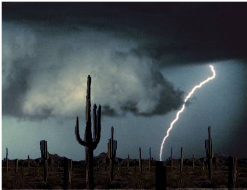
Slika 7: Nenadna nevihta

V tem pasu prevladujejo suhi severovzhodni pasati.