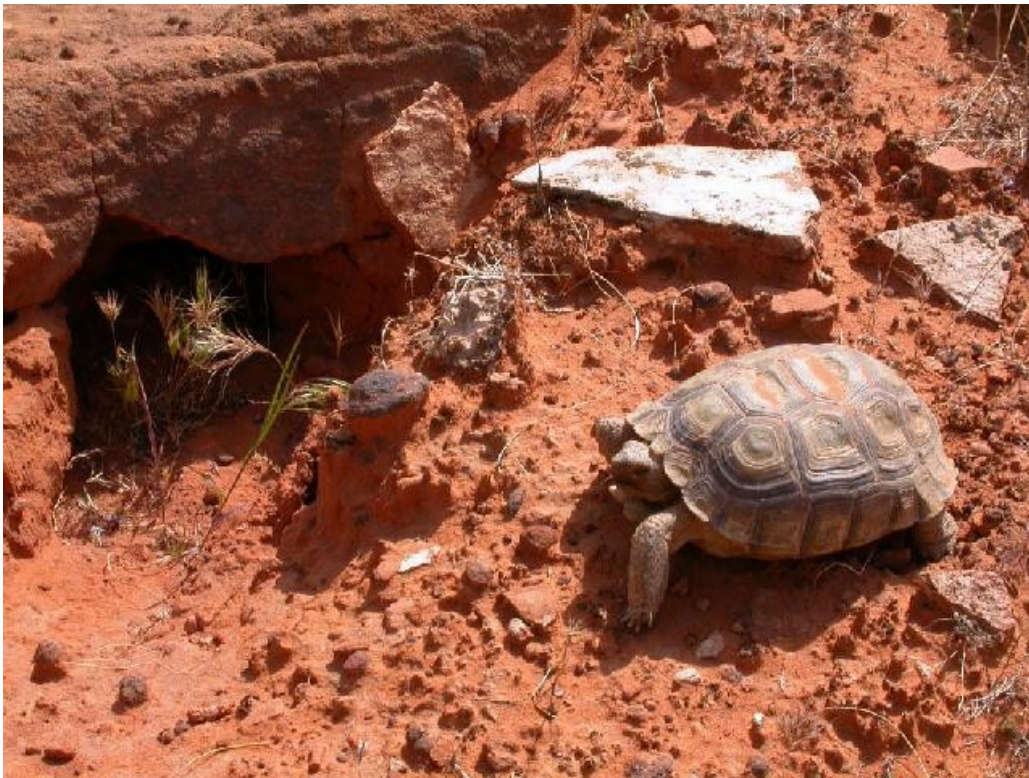
Slika 5: Napad puščavske kače

Rastline so se izjemno prilagodile neugodnem podnebjju. Večina rastlin ima dolge korenine, ki ob občasnih deževjih shranijo vsako kapljico talne vode. Tudi oblike listov so popolnoma prilagojene-listi so špičasti in običajno povoskani. Edina območja, ki pa so popolnoma brez rastlinstva so gručaste puščave. Živalstvo v puščavi je omejeno na veliko vrst žuželk, ptic ter glodavcev.