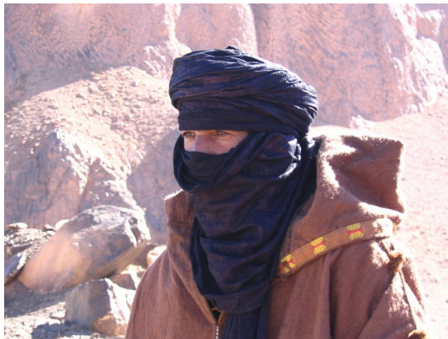
Slika 4: Tuareg

Zaradi sušnih obdobj, političnih in tehničnih sprememb, zaradi katerih nomadi opuščajo stare življenjske, se je začel proces dezertifikacije. Nomadi se za stalno naseljujejo na tem zelo občutljivem ekosistemu, ki ga poleg pogostih suš dandanes ogroža tudi prenakomerno izčrpavanje zemlje. Puščava se počasi pomika v območja Sahela, kjer ne uspevajo več razni pridelki, ki so prebivalce oskrbovali s hrano. Zaradi pogostih suš vsako leto umre na tisoče ljudi.