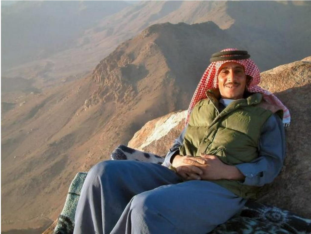
Slika 1: Beduin na počitku

Sahara je največja peščena puščava na svetu. Leži v Severni Afriki in obsega prek 9 milijonov km 2 , če vštujemo tudi sosednja na pol suha področja.