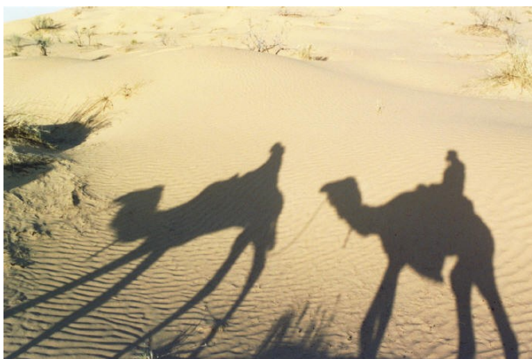
Slika 9; Na poti čez Saharo

11.12.2005, http://en.wikipedia.org/wiki/