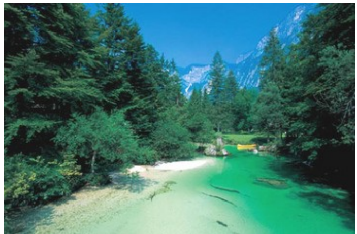
Sava Bohinjka, ki izvira iz Bohinjskega jezera.