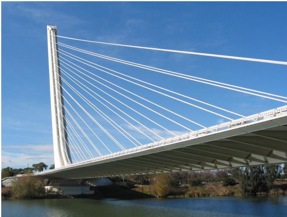
Sl. 4: Alamillski most

Zgrajen je bil med leti 1989 – 1992, zasnoval ga je španski arhitekt Santiago Calatrava. Gradnja mostu je predstavljala del priprav na razstavo Expo '92, ko so gradili nove mostove za ustrežnejšo povezavo med deli mesta. Most prečka znamenito reko Guadalquivir. Hkrati je velik, puščavnat otok (Isla de Cartuja), ki leži v reki Guadalquivir, približal Seville. Za most je značilna asimetrična podoba. Prepoznamo ga po visokem drogu, ki s trinajstimi pari kablov podpira njegovo težo. Dolg je 200 metrov, drog pa sega 140 metrov v višino.