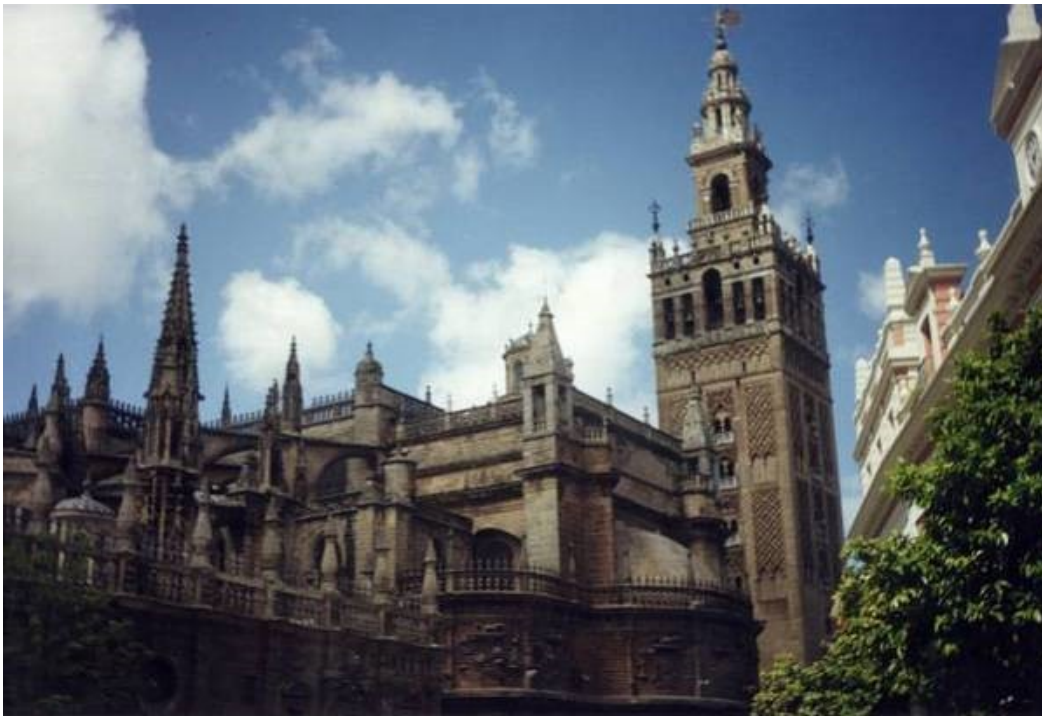
Sl. 6: Seviljska katedrala

Seviljska katedrala je v poznem 12. stoletju zasedla mesto velike mošeje. Pozneje so krščanski arhitekti