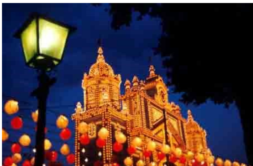
Sl. 18: Feria de abril

Sevilla je eno najbolj vročih španskih mest in najvišje temperature se pojavljajo v mesecih juliju in avgustu. Takrat se domačini umaknejo iz mesta in gredo na dopust. Mesto je znano tudi po visokih cenah; za nekatera prenočišča je treba odšteti kar 50% celotne cene več kot pa v drugih španskih mestih.