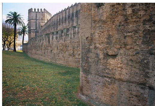
Sl. 13: Mestni zidovi

Zidovi Seville so bili prvič zgrajeni za utrditev mesta leta 1135 pod Almoravidovo vlado. V 13. stoletju so bili okrepljeni in razširjeni za šest kilometrov, vključno s stošestnajstimi stolpi in devetimi mestnimi vrati. V letu 1860 so bili do tal porušeni, da bi se mesto lažje širilo in se razvijalo. Danes stoji samo del zidu med Cordobo in Macareno. Ima sedem stolpov, vključno z Torre Blanco in Torre del Oro delom, ki datirata v 13. stoletje. Nekaj časa je bila glavna naloga utrdb varovanje mesta, danes pa Torre de Oro služi kot pomorski muzej.