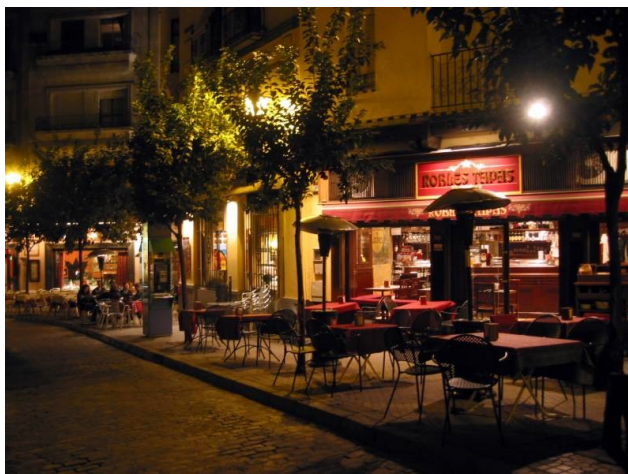
Sl. 14 - Seviljske ulice ob večerih

Seviljci so znani kot duhoviti, preprosti in živahni ljudje. Mesto oddaja edinstveno življenjsko energijo. So odlični igralci in svoje znanje prikazujejo na neobičajnih prireditvah. Nemalokrat organizirajo tudi sprevode in procesije, ki še dodatno popestrijo vzdušje.