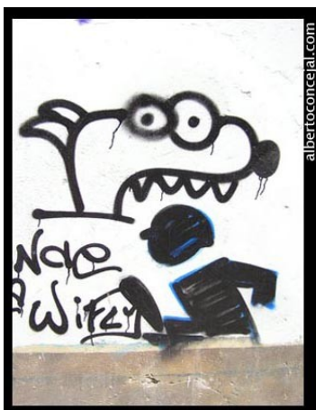
Sl. 17: Grafit s sevilske ulice