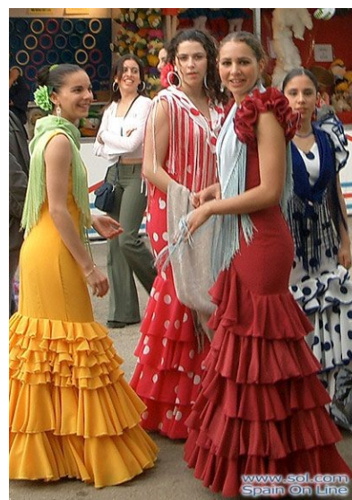
Sl. 15: Plesalke flamenka

Vsako pomlad mesto Sevilla pripravi festival, ki traja ves teden - Feria de Abril. Prireditve vsako leto obišče milijon obiskovalcev. Začetki prireditve segajo v leto 1847 in skozi desetletja se je spremenila v tradicionalni spektakel flamenka in bikoborb. Že nekaj tednov pred festivalom Seviljci poskrbijo, da je mesto okrašeno z lampinjoni, lučmi papirnatimi lanternami. Med festivalom postavljajo šotore, jih imenujejo casetas in pod njimi plešejo. Postanejo nekakšne začasne plesne dvorane, kjer vsak večer od devete ure zvečer do šeste ure zjutraj vrtijo glasbo in se zabavajo ob plesanju flamenka. Ženske so oblečene v posebne tradicionalne obleke, namenjene temu plesu. Festival ne poteka le ob večerih, ampak so aktivnosti nanizane tudi čez dan. Po ulicah najdemo pevce skitarami, ki igrajo tradicionalne seviljske balade.