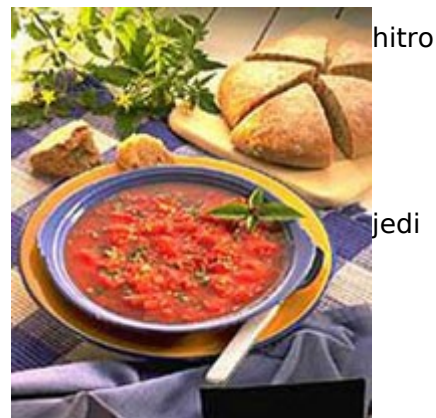
Sl. 16: Tradicionalna sevilska jed

Seviljci niso znani po pretiranem obiskovanju restavracij s in nezdravo prehrano. V Sevilli najdemo samo restavracije, ki ponujajo tradicionalno andaluzijsko hrano. Najbolj znan način prehranjevanja je »ir de tapeo«, kjer postavijo na mizo več posod različne hrane. Namen je poskusiti čimveč različnih ter sestaviti najokusnejšo kombinacijo. Solate, gazpacho, salmorejo, flamenco eggs, ledvice s šerijem (vino iz južne Španije), nadevana artičoka in ocvrte ribe so ene najbolj značilnih jedi.