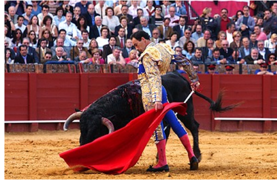
Sl. 5: Bikoborec

Plaza de Toros je arena, zgrajena med letoma 1761 in 1880, kjer se še danes odvijajo bikoborbe. Ovekovočena je bila že v Bizetovi operi Carmen. Arena sprejme 14.000 ljudi in zvoki se enako slišijo po celi areni, ne glede na kje se nahajaš. Glavni vhod je okrašen z originalnimi železnimi vrati ženskega samostana 16. stoletja. Na sredini arene je vzpetina, kar daje bikoborcu prednost, da lahko z nje steče za ograjo, medtem ko se mora bik prej ustaviti, če noče zaleteti v hrib. Sezona bikoborb