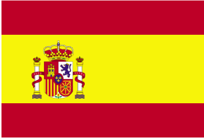
Sl. 2: Španska zastava z grbom