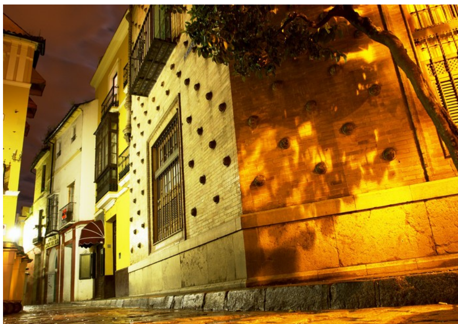
Sl. 20: Sevilla ponoči

28. december - »Los Santos Inocentes«. To je dan, ko ljudje zbijajo šale (kot prvega aprila pri nas).