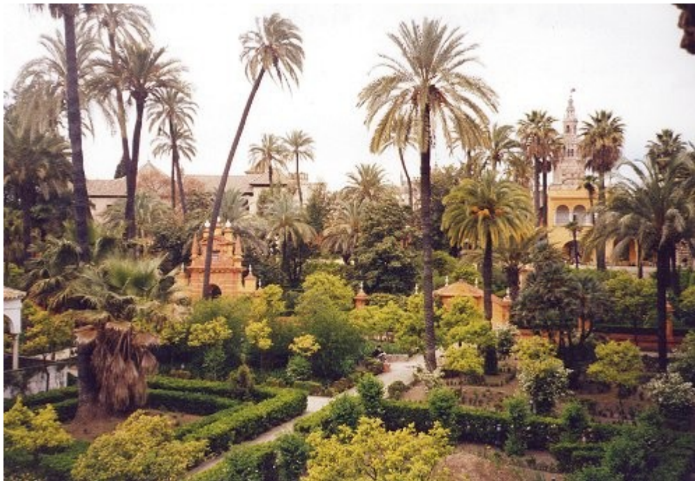
Sl. 12: Vrtovi Seviljskega Alcazarja