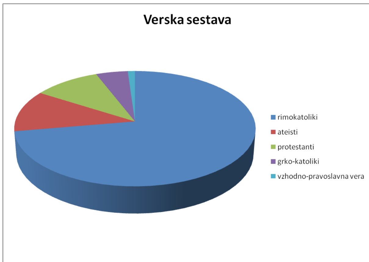
Graf 1: Verska sestava prebivalstva

Okoli 60% vseh prebivalcev pripada rimskokatoliški cerkvi. 9,7% jih je ateistov, 8,4% prebivalcev so protestanti, pribl. 4% jih pripada grškokatoliški cerkvi, 0,9% vzhodno-pravoslavni cerkvi. Od predvojnih 120.000 Judov jih je do danes ostalo le okoli 2.300.