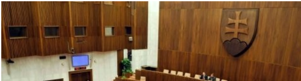
Slika 3: Notranjost slovaškega parlamenta

Najvišji organ slovaške politike je državni zbor, ki ima 150 sedežev. Poslance se voli na podlagi priporočila ustavnega sodišča za mandat štirih let. 13 članov določi predsednik.