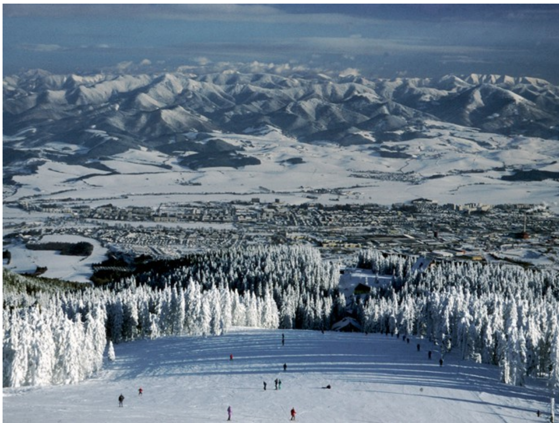
Slika 2: Pokrajina | Velika Fatra

Najdaljša slovaška reka je Váh, ki izvira v Visokih Tatrah, teče skozi severno in zahodno Slovaško ter se po 403 km pri Komárnu izliva v Donavo. Pomembna reka je tudi Hron. Območje okoli Rožňave (zahodno od Košic) je zakraselo z značilnimi kraškimi pojavi.