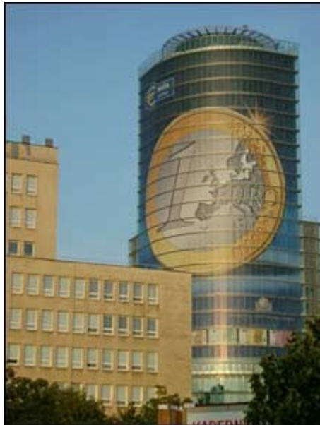
Slika 5: Slovaška narodna banka

Marca 2008 je minister za finance oznanil, da je slovaška ekonomija dovolj razvita, da se preneha prejemanje pomoči iz svetovne banke. Pomoč so prenehali izplačevati v decembru 2008.