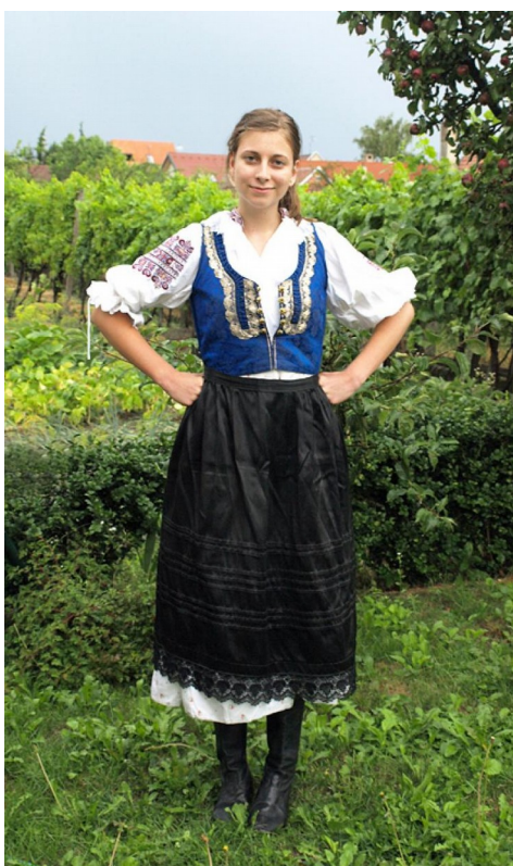
Slika 1: Slovaška narodna noša iz okolice Košic

Uradni jezik je slovaščina, na nekaterih področjih, zlasti na jugu in vzhodu države, ima madžarščina status drugega uradnega jezika.