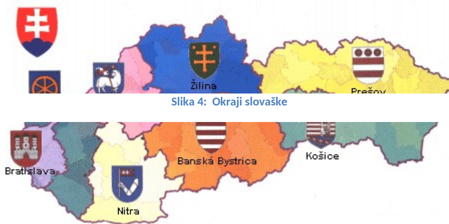
Slika 4: Okraji slovaške

Okraji se nadalje delijo na skupno 79 okrožij (ed. okres, mn. okresy).