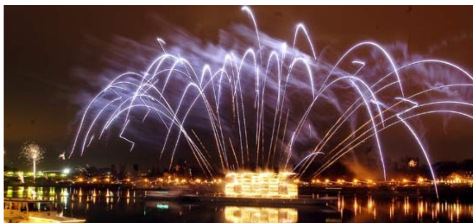
Slika 7: Bratislava za Novo leto 2005

Obhajajo pa tudi še 16 drugih spominskih dni, ki pa niso dela prosti.