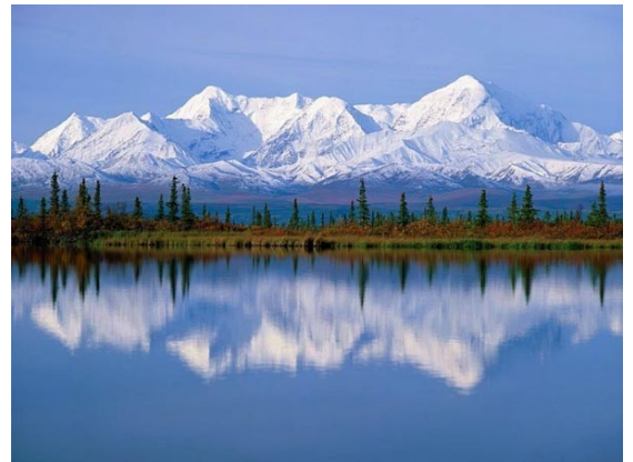
Slika 6: Tatry

Jelke še rastejo po krivánski strmini. Kdor kot Slovak živi, naj se z mečem bori v naši sredini.